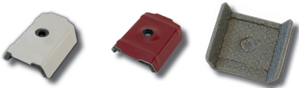
Caballete para chapa grecada con polietileno.