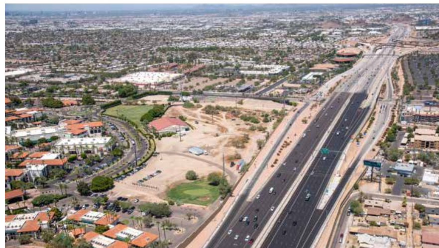
Carriles colectores-distribuidores en Broadway hacia el oeste.

los cuales ayudarán a mantener el flujo del tráfico en esta autopista. Sin embargo, la zona de trabajo de este proyecto continúa activa por lo que debemos estar atentos a los señalamientos y trabajadores en el área. Los automovilistas del área de Phoenix que necesitan entrar o salir de la I-10 en el área de la Curva Broadway,