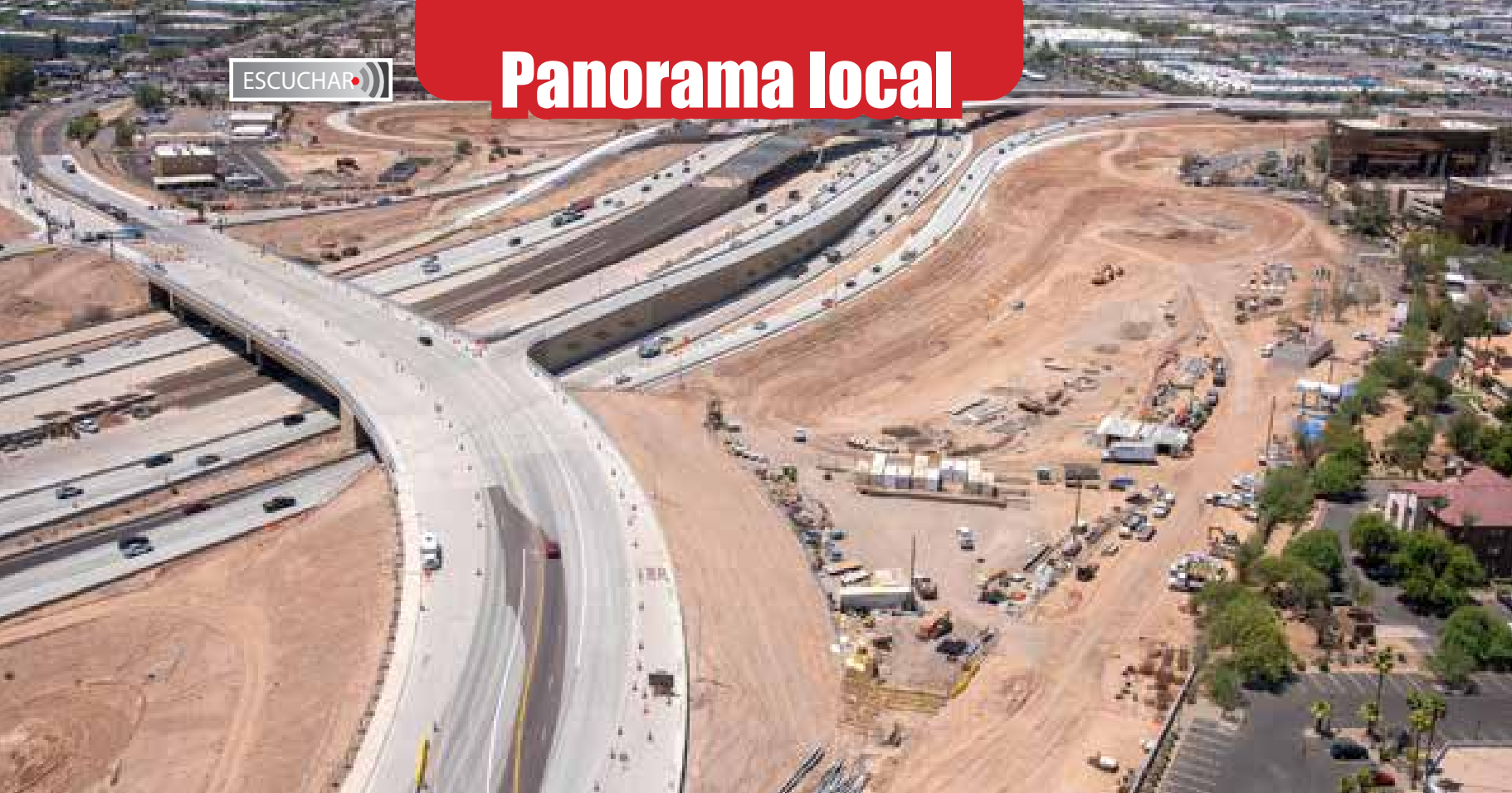
Carriles colectores-distribuidores en Baseline hacia el oeste.