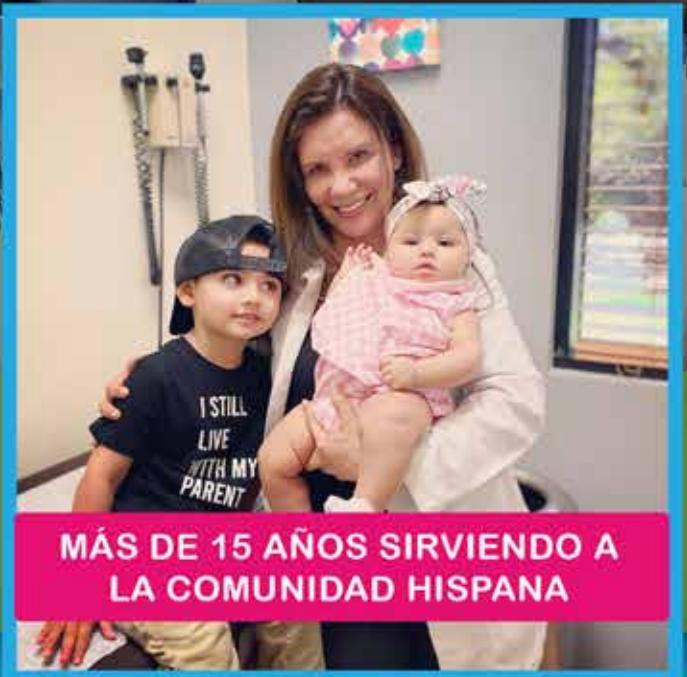
MÁS DE 15 AÑOS SIRVIENDO A LA COMUNIDAD HISPANA

Estamos autorizados por el Servicio de Ciudadanía e Inmigración de los Estados Unidos para hacer todos los exámenes y pruebas que usted necesita para arreglar su situación migratoria