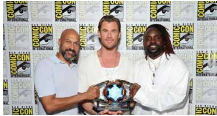
Keegan-Michael Key, Chris Hemsworth y Brian Tyree Henry en el evento ComicCon International en San Diego.

Es la historia del origen jamás contada de Optimus Prime y Megatron, más conocidos como enemigos jurados, pero que alguna vez fueron amigos unidos como hermanos que cambiaron el destino de Cybertron para siempre. Esta es la primera película de Transformers completamente animada por computadora y cuenta con un elenco de voces repleto de estrellas, que incluye a Chris Hemsworth, Brian Tyree Henry, Scarlett Johansson, Keegan-Michael Key, Steve Buscemi, Laurence Fishburne y Jon Hamm. Transformers One llega a las salas de cine el 20 de septiembre de 2024.