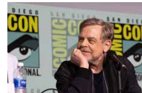
Fotografía: Paramount Pictures