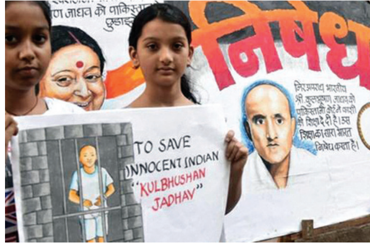
(ડાબે) મુંબઈમાં પૂર્વ ભારતીય નૌકાદળના અધિકારી કુલભૂષણ જાધવના પેઈન્ટિંગને ડિસાલ્વે કરતી યુવતીઓ. જાધવને પાકિસ્તાન મિલિટરી કોર્ટે 'જાસૂસી'ના આરોપસર મૃત્યુદંડની સજા ફરમાવી છે. (જમણે) જાધવને મૃત્યુદંડની સજા સામે મુંબઈમાં કોંગ્રેસ કાર્યકરોએ વિરોધપ્રદર્શન કરી પાકિસ્તાની ધ્વજ સળગાવ્યો હતો.

આ મુદ્દે ભારતે આકરો વિરોધ નોંધાવ્યો છે અને કહ્યું છે કે જો એક ભારતીયને કાયદા અને ન્યાયના મૂળ માપદંડો ધ્યાનમાં રાખ્યા વગર સજા અપાશે તો ભારત સરકાર અને ભારતીયો તેને પૂર્વઆયોજિત હત્યાનો મામલો ગણશે. ભારતે પાકિસ્તાનના ડઝન કેદીઓને છોડવાનો નિર્ણય હવે બદલી નાખ્યો છે. દિલ્હીમાં