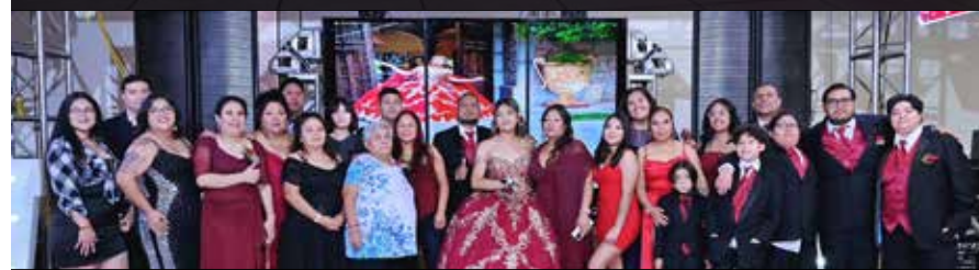
¡Qué familia! De lado de la madre y del lado del padre, toda la familia se hizo presente para felicitar a la quinceañera y compartir el bello recuerdo que significa poderlos tener bajo un mismo techo y en una fecha especial y única.