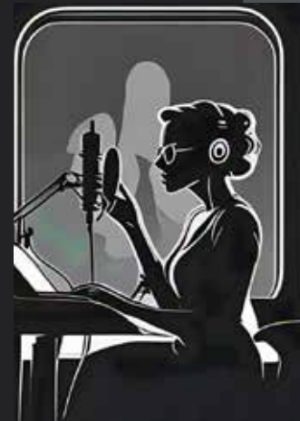
Imagen: Meta AI

A partir de ese momento sintió que debía compartirle al mundo sus experiencias y conocimientos. Por ello creó La Verdad del Ser en noviembre de 2022.