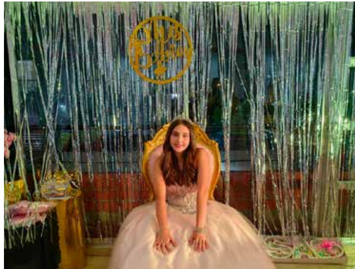
En la ciudad de Bogotá, en Colombia, fue la presentación en sociedad de "Isabelita" como le dicen quienes la aman y aprecian. Ella con una elegancia descomunal recibió a sus invitados con la sonrisa y el encanto que la caracterizan. ¡Se creció la niña!