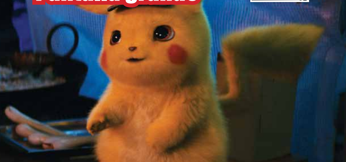
Detective Pikachu (Ryan Reynolds)