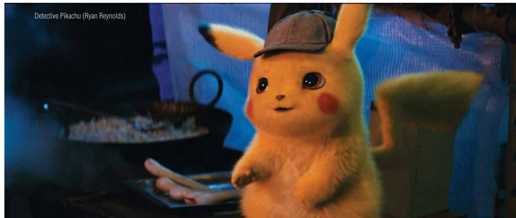
Detective Pikachu (Ryan Reynolds)