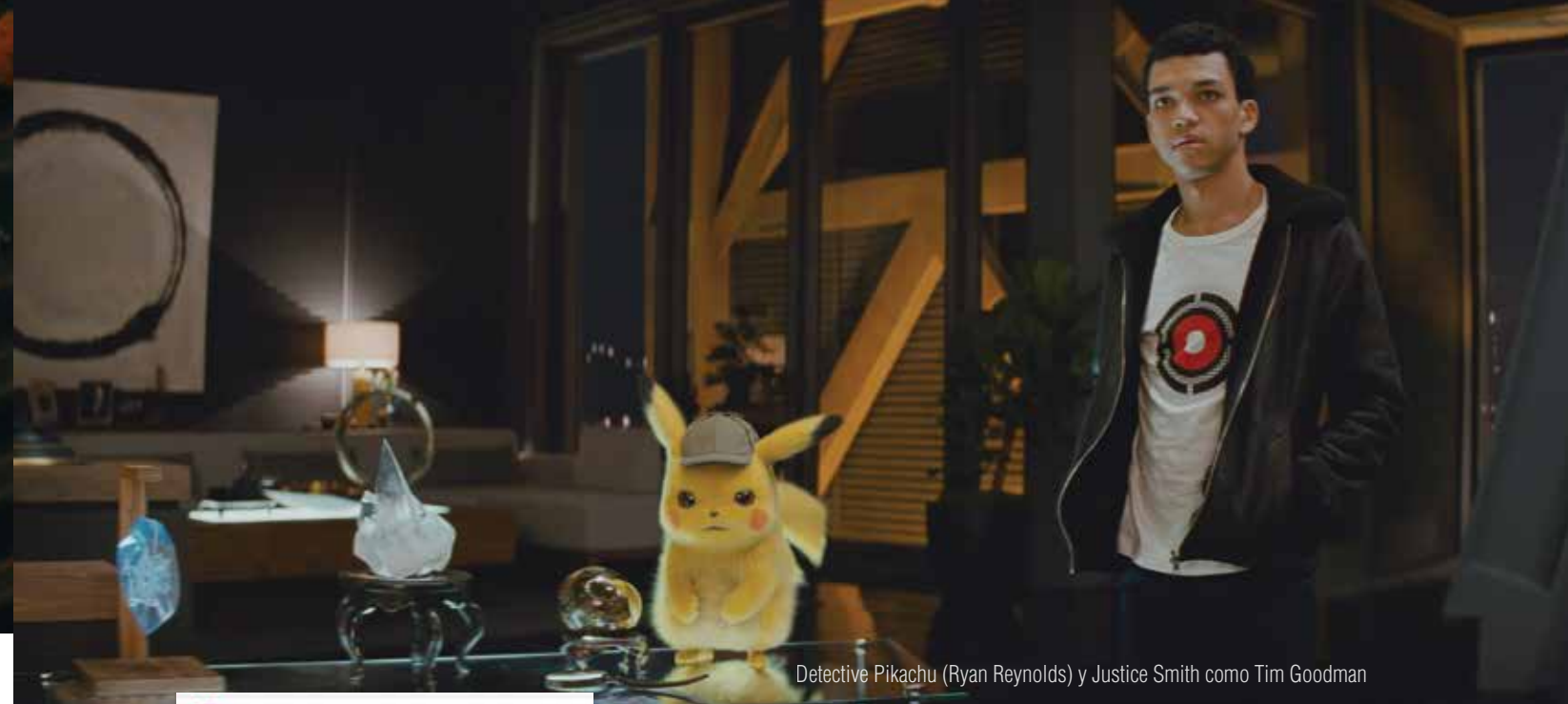
Detective Pikachu (Ryan Reynolds) y Justice Smith como Tim Goodman