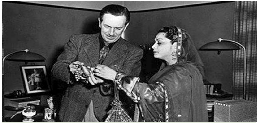
Rare picture of U.S.-Pakistani friendship: Rana Liaquat, wife of Pakistan’s first Prime Minister, Liaquat Ali Khan, with famous American animator, film-maker and entrepreneur, Walt Disney, in 1951. Who is your favorite Disney character?