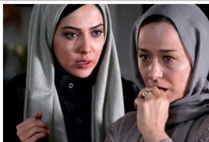
فیلم سینمایی «لاله»