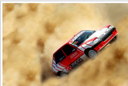
فیلم سینمایی «لاله»