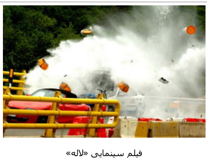
فیلم سینمایی «لاله»

یکی از مالکان کمپانی کانادایی «درابو» درباره مسائل مطرح شده درباره مشخص نبودن بحث مالکیت پروژه «لاله» بیان کرد: به گفته مرکز برای پروژه «لاله» قراردادی وجود ندارد ولی خدای ایشان می‌داند که توافق وجود دارد و تمام این شاهدان می‌توانند شهادت بدهند. پس چرا در مقابل غرور خود از خداوند کمک نمی‌گیرید؟ من همان روز اول گفتم که بیایید مسائل قانونی پروژه را حل و فصل کنید و کپی را بیتی را که در اختیار شرکت کانادایی «درابو» است را به نام خودتان کنید تا قانونا در کل دنیا مالک پروژه باشید. این چه مطلب مشکلی است که این دوستان متوجه نمی‌شوند؟ مشخصا تأیید شده که مرکز گسترش ۸۰ درصد و شرکت درابو ۲۰ درصد از پروژه را در اختیار دارند. این مطلب طبق موافقت مدیران قبلی یا بنده تمام شده است.