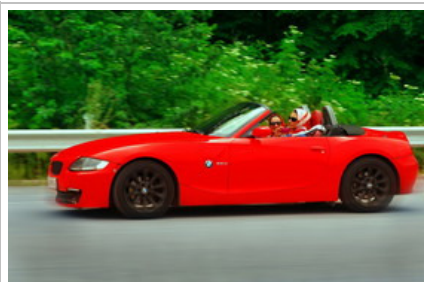
فیلم سینمایی «لاله»