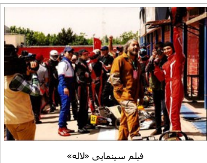
فیلم سینمایی «لاله»