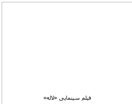
فیلم سینمایی «لاله»