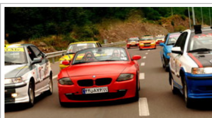
فیلم سینمایی «لاله»