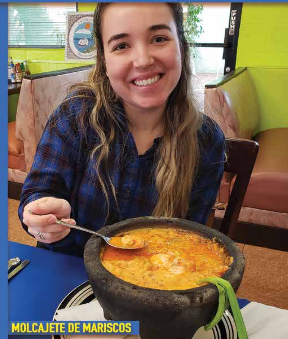
MOLCAJETE DE MARISCOS