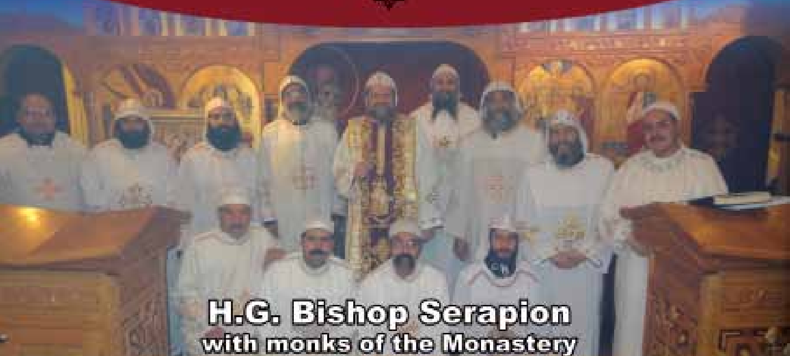
H.G. Bishop Serapion with monks of the Monastery