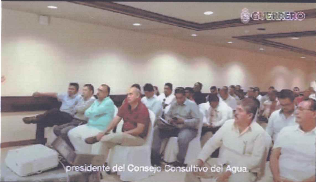
presidente del Consejo Consultivo del Agua.