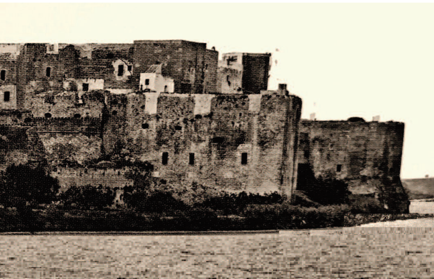
Sopra Il castello Svevo nell'800 prigione del generale Dumas che è ritratto nell'opera a sinistra. A destra la copertina del libro «Il Conte di Montecristo»

e due anni di eventi, che a momenti furono veramente incalzanti, trascorsi in una Brindisi ignara di quell'appuntamento con la leggenda – quella del conte di Montecristo – che la storia gli aveva posto in serbo. Il generale Dumas, infatti, oltre ad essere “un militare sperimentato, un fervente repubblicano, un uomo di grandi convinzioni e spiccato valore morale, famoso per la sua forza fisica la sua destrezza con la spada il suo coraggio e la sua naturale capacità a districarsi con disinvoltura dalle situazioni più difficili, conosciuto per la sua impertinza arrogante e per i suoi problemi con le autorità, generale tra soldati temuto dai nemici ed amato dai suoi uomini, un eroe in un mondo in cui tale appellativo non si attribuiva alla leggera” fu anche il padre del prestigioso romanziere Alexandre Dumas, autore dei Tre moschettieri e del Conte di Montecristo, i due archi famosi romanzi per i quali l'indubbio ispiratore fu proprio quel padre generale con la sua rocambolesca esistenza: quella di Thomas Alexander Davy de la Pailletterie, o più semplicemente Alex Dumas, come preferì firmarsi dopo essere asceso per merito proprio fino al grado di generale di divisione.