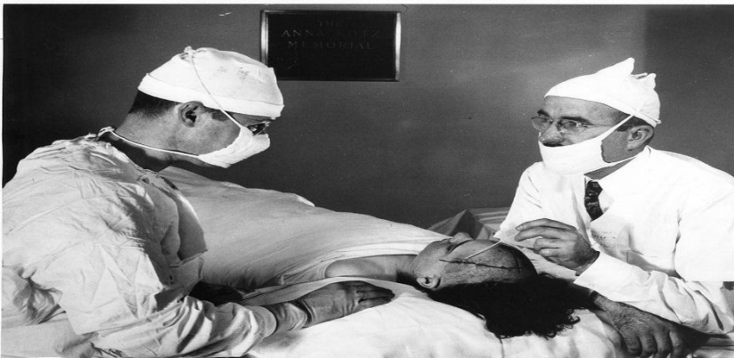
Walter Freeman, right, and James Watts performing a prefrontal lobotomy in 1942.

Con todo y este tipo de incidentes, el procedimiento quirúrgico seguía siendo bien recibido por un porcentaje considerable de familiares de los excombatientes, puesto que estos casos fueron manejados con extrema discreción. Sin embargo después de que se repitieran las quejas por los mismos resultados en diferentes pacientes, The Veteran Administration limitó el procedimiento a cuatro cláusulas de las que se destaca la sujeción de la operación a la decisión exclusiva de los familiares más cercanos al enfermo y la obligatoriedad de ejecutar el procedimiento solo a pacientes en los que se hayan agotado todas las posibilidades sin recibir resultados 24 .