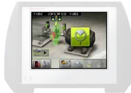
Repetir la medición