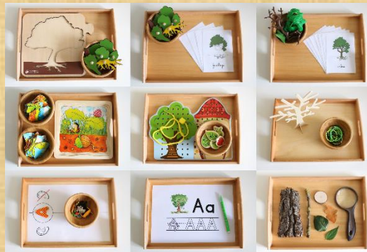
Plateaux de vie pratique