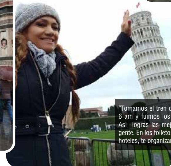
“Tomamos el tren desde Florencia a las 6 am y fuimos los primeros en entrar. Así logras las mejores fotos sin tanta gente. En los folletos de Florencia, en los hoteles, te organizan el tour.