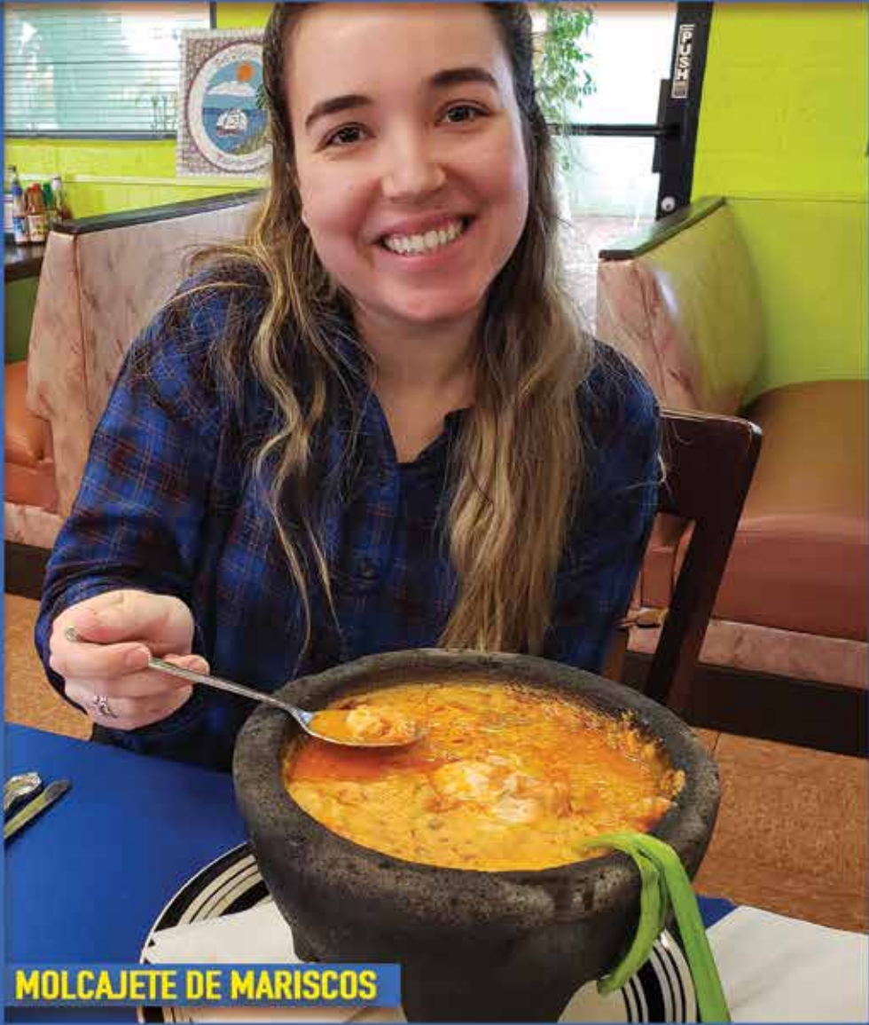
MOLCAJETE DE MARISCOS