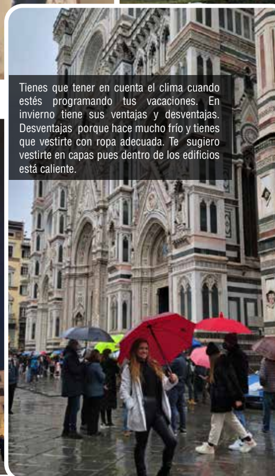
Tienes que tener en cuenta el clima cuando estés programando tus vacaciones. En invierno tiene sus ventajas y desventajas. Desventajas porque hace mucho frío y tienes que vestirte con ropa adecuada. Te sugiero vestirte en capas pues dentro de los edificios está caliente.