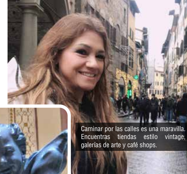
Caminar por las calles es una maravilla. Encuentras tiendas estilo vintage, galerías de arte y café shops.