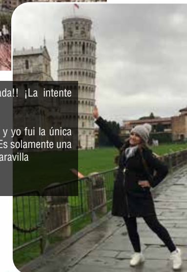
La torre Pisa. ¡¡Cada vez más inclinada!! ¡La intente enderezar!