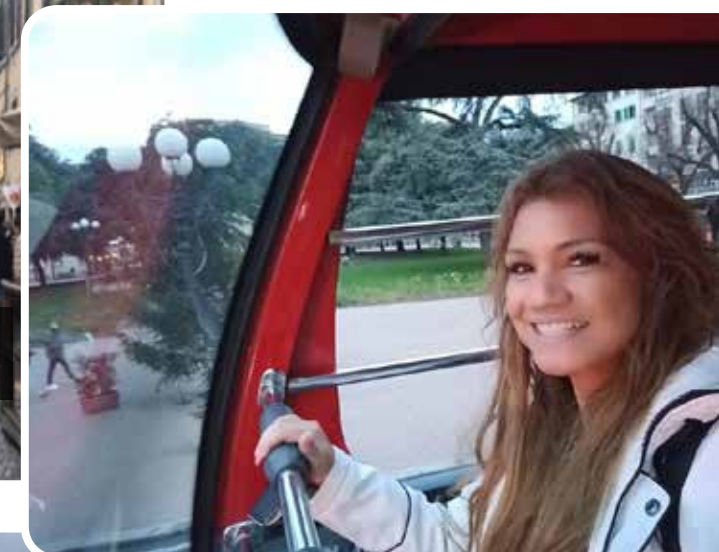
Puedes tomar el top-bus bajarte donde quieras y caminar hasta la siguiente estación para que disfrutes de los jardines y la vista de la ciudad.