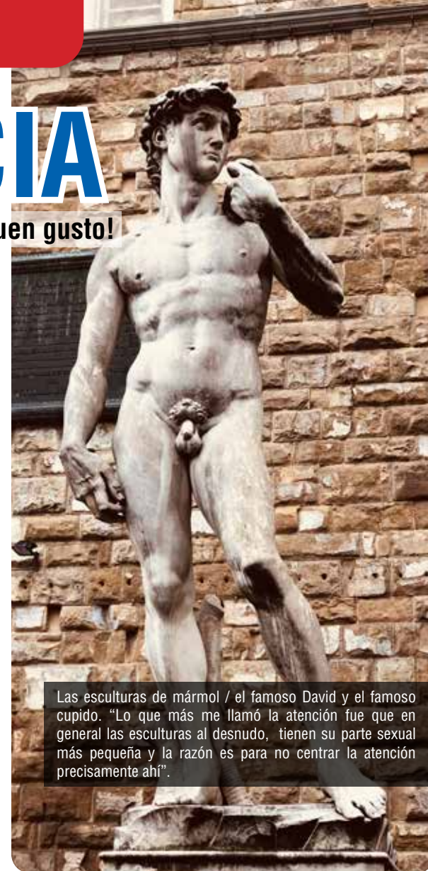
Las esculturas de mármol / el famoso David y el famoso cupido. “Lo que más me llamó la atención fue que en general las esculturas al desnudo, tienen su parte sexual más pequeña y la razón es para no centrar la atención precisamente ahí”.