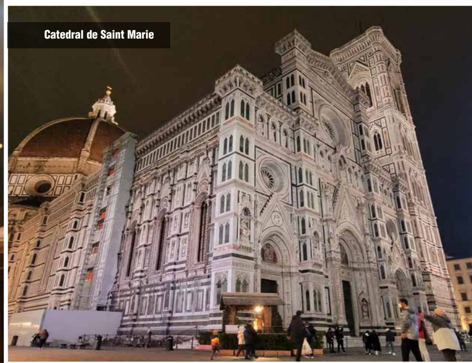
Catedral de Saint Marie

Puedes escoger tu steak y por supuesto con vino rojo. Ni de peligro te dan vino blanco porque el vino rojo es para la carne roja, es parte del paladar y del gusto. Intentamos pedir vino blanco y la respuesta fué “noooo ni de peligro”. Pues cambia el sabor del steak y no sabe igual”.