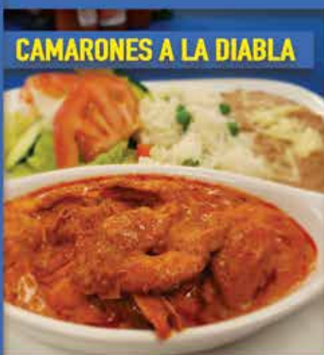
CAMARONES A LA DIABLA

ABRIMOS TODOS LOS DÍAS 9201 S. Avenida del Yaqui Guadalupe, AZ 85283 480-839-2991 www.sandiegobayseafood.com