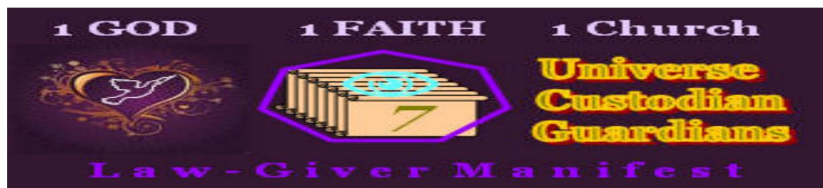
监护人 监护人 宣告者 20.01.1.1