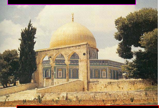
ጌታ ኢየሱስን፥ ተወልዶ በስምንተኛው ቀን የቀረበበትና ስምዎን የተባለው ዳድቅ ሰው፥ ተቀብሎ አቅፎ እግዚአብሔርን ያመሰገነበት መቅደስ በዚህ ሥፍራ ነበር። (ሉቃስ 2 ፥ 25 - 32)

ይህ በእየሩሳሌም የሚገኘው ዶም እና ዘርክ የተባለው ሕንፃ ነው። ይኸውም የቀድሞው መቅደስ በነበረበት ሥፍራ ላይ የተሠራ ነው።