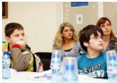
Абдул Або Абед VI б

Тръгнахме си от издателството с подарък - книгата на Калина Михова „Творческо писане“ и заредени с много положителни емоции.