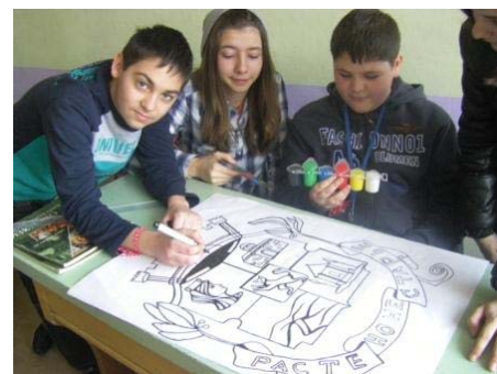
Етапи на работата и постигнатите резултати