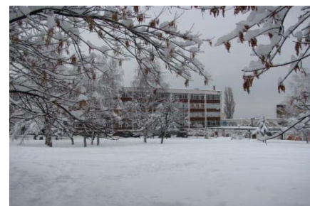
НСОУ „София“ през погледа на учениците от клуб „Аз, фотографът“