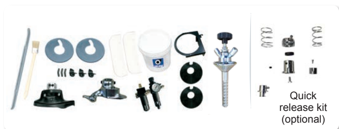
Quick release kit (optional)

THE REAL "WORK-HORSE" FOR YOUR TYRE SHOP!!