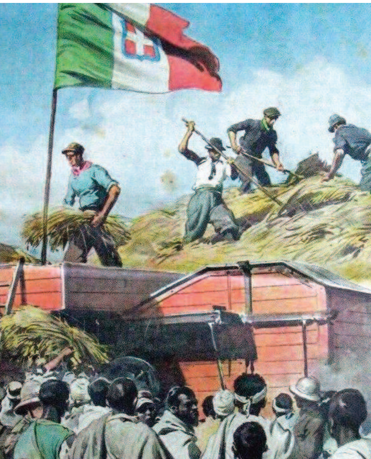
LE IMMAGINI “La prima messe dell’Impero: in territorio di Oletta a 40 Km da Adis Abeba, dove i coloni hanno organizzato vaste piantagioni sperimentali, è stato festosamente trebbiato il primo grano d’Etiopia coltivato da Italiani” (Copertina della Domenica del Corriere del 16 gennaio 1938) Sotto 26 gennaio 1938: Partenza da Brindisi del 1° nucleo rurali dell’Ente di Colonizzazione Puglia d’Etiopia