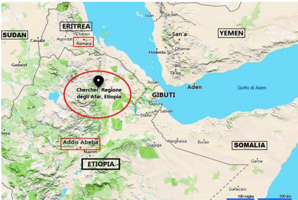
Etiopia, Regione degli Afar, Provincia del Chercher: Area dell'Ente di Colonizzazione di Puglia d'Etiozia