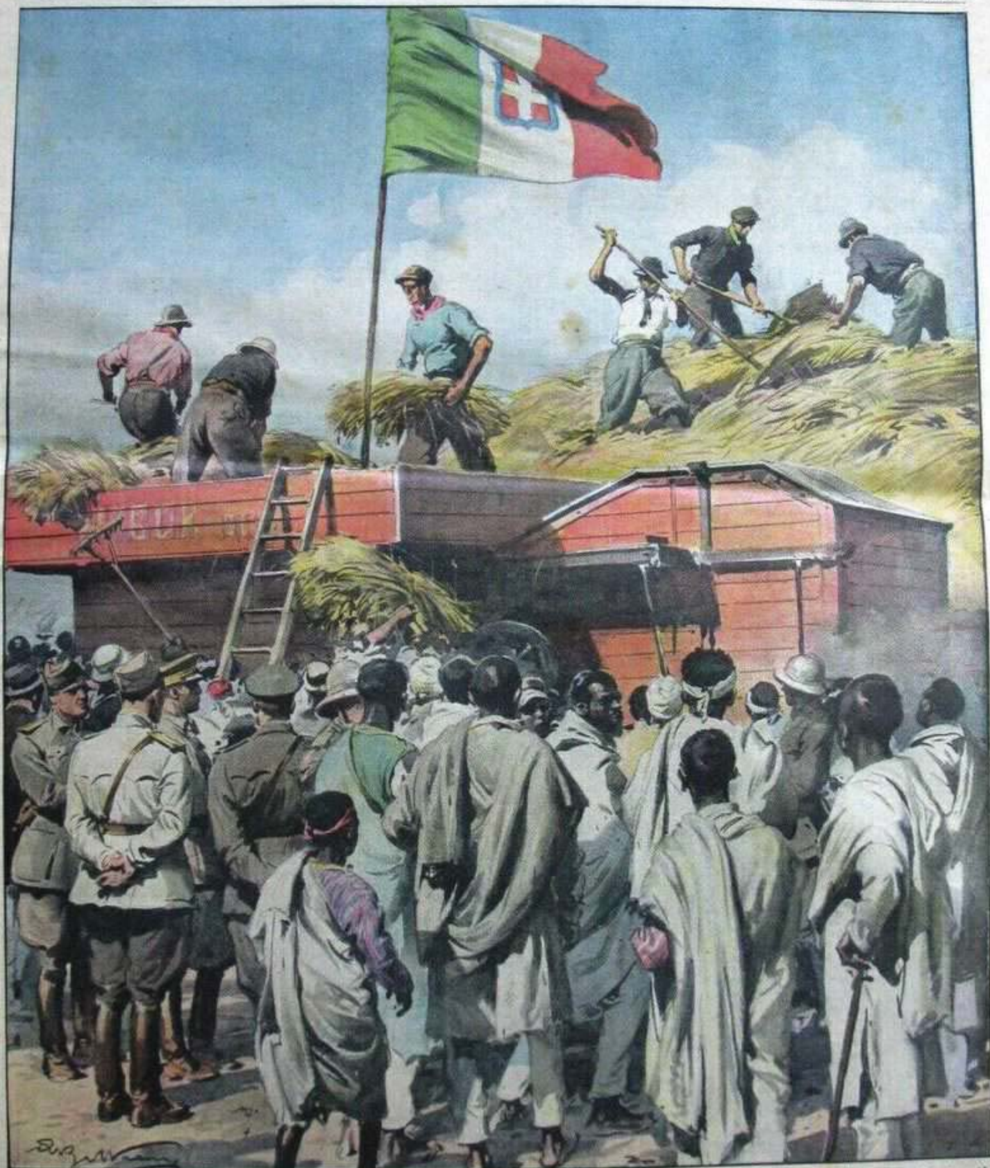
La prima messe dell'Impero. Nel territorio di Oletta, a 40 chilometri da Addis Abeba, dove gli ex-combattenti hanno organizzato vaste piantagioni sperimentali, è stato festosamente trebbiato il primo grano d'Etiopia coltivato da Italiani. Assistevano le autorità e molti indigeni. (Disegno di A. Beltrame)