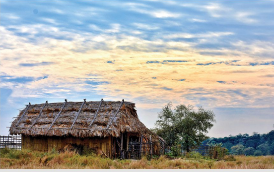
By Arpana Gogoi My wish is to stay always like this, living quietly in a corner of nature (D.El.Ed. 3 rd Semester)