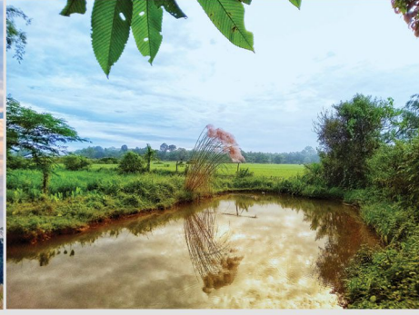
By Parishmita Gogoi প্রকৃতির গগন চুম্বনৰ এইয়া এক বিস্তৃত সংগম (D.El.Ed. 3 rd Semester)