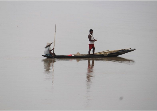
By Nitumoni Gogoi নৈ পৰীয়া সপোন (D.El.Ed. 1 st Semester)