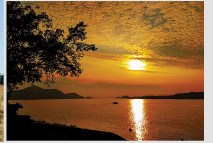
By Sonal Jaiswal Golden hour of twilight (D.El.Ed. 1 st Semester)