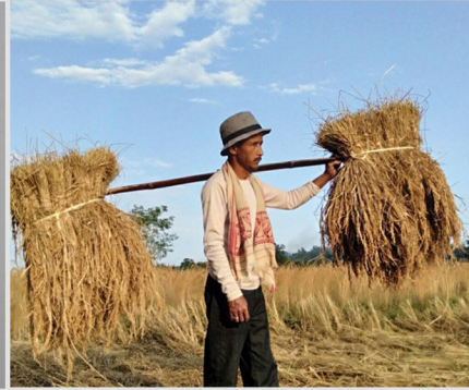
By Bismita Gogoi আঘোণৰ পথাৰৰ মেটমৰা ভাৰ (D.El.Ed. 1 st Semester)