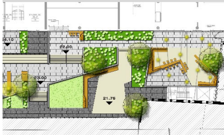
Maison à soins palliatifs du Saguenay