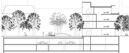
Complexe Hôtelier – Honey Rose