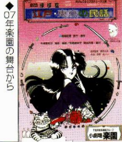
◆07年楽園の舞台から