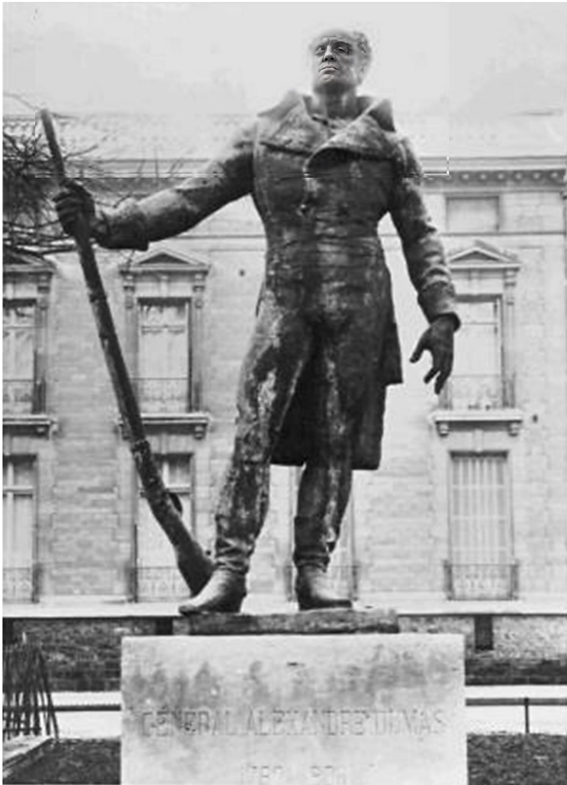
Statua del generale Alexandre Dumas in Parigi, dello scultore Alfred Moncel Eretta nel 1912 e abbattuta dalle truppe tedesche nel 1942 Il generale che fu prigioniero per lungo tempo a Brindisi