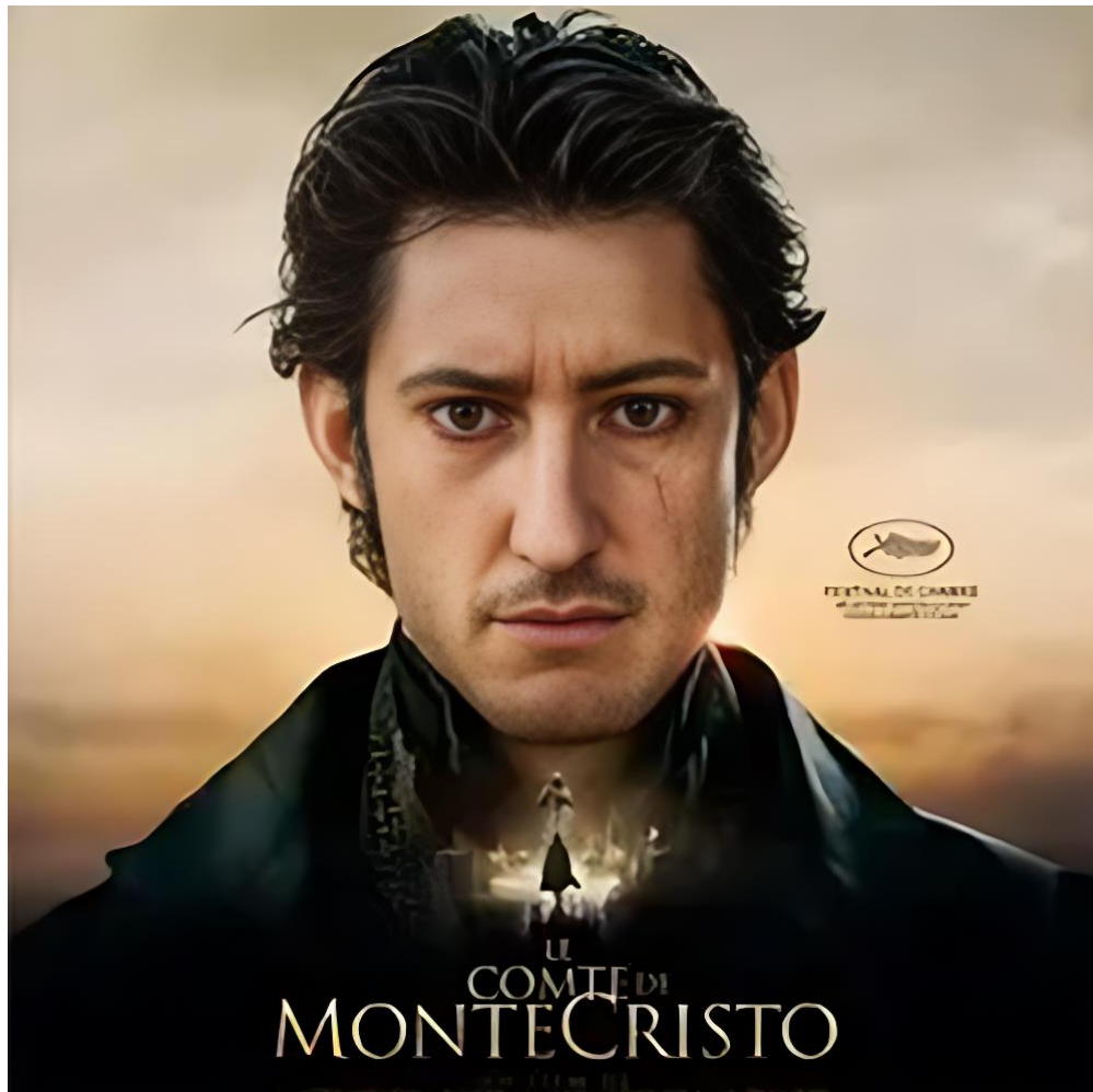
Sam Claflin interpreta Edmond Dantès nella versione cinematografica 2024