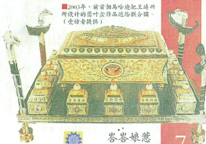
2003年，前首相馬哈迪把王連興所設計的薈葉盒作品送給聯合國。(受訪者提供)