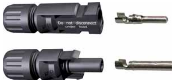
Presentación del conector macho y hembra MC4 con los contactos correspondientes.