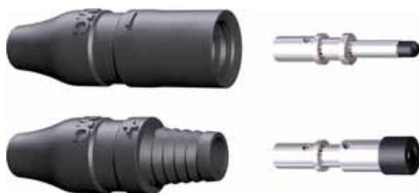
Presentación del conector macho y hembra MC3 con los contactos correspondientes.