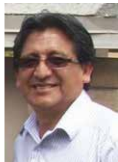
Por FRANCISCO JAUREGUI

En Julio se celebran en este país y el Perú el día de la independencia. La comunidad peruana residente en Arizona celebrará los 203 años de haber dejado atrás el yugo colonial de España, cuya proclama se realizó un 28 de julio.