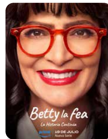
Betty la Fea, la Historia Continúa

Esta continuación la podemos considerar como un homenaje a Fernando Gaitán, la mente creadora de la novela original y quien falleció hace unos años: "Sí, espero que desde donde esté, yo creo que nos acompaña y estará contento y feliz por haber hecho esto. Me encantaría que supiera lo que lo extrañamos"