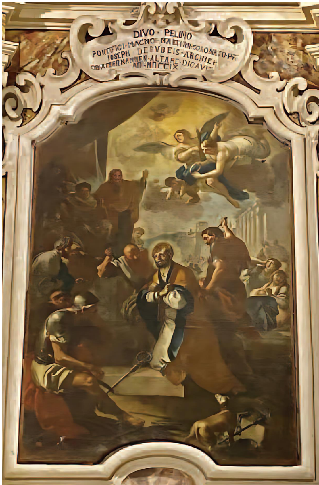
Il martirio di san Pelino - Dipinto settecentesco di Oronzo Tiso nella cattedrale