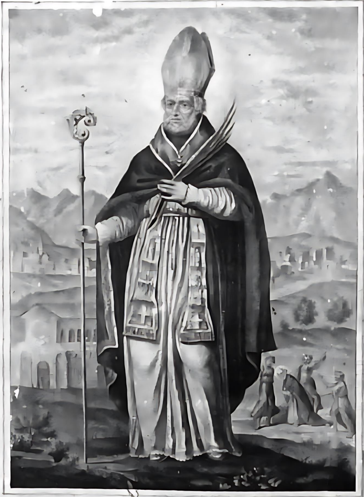
S. PELINUS BRUNDUCII EPISCOPUS