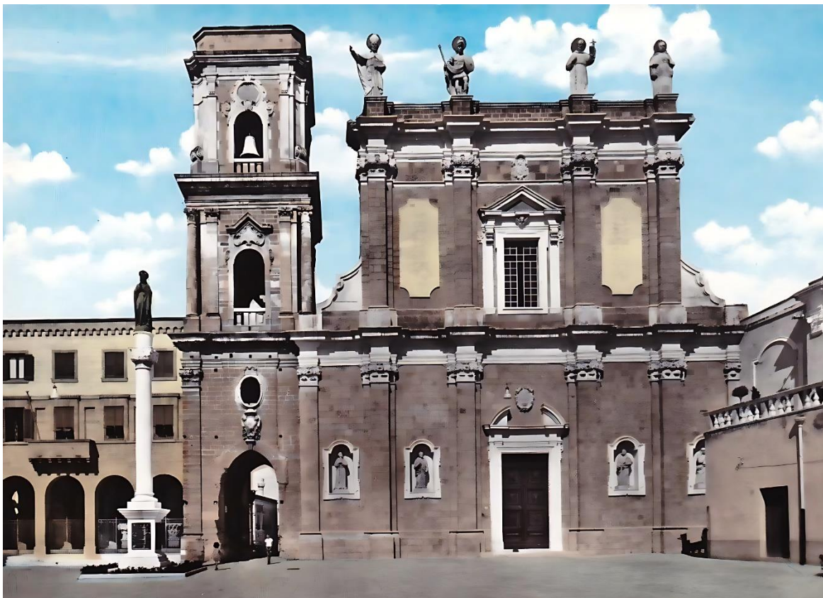
La cattedrale dopo il restauro del 1957-59 con, al posto del timpano, le quattro statue La statua di san Pelino è quella della destra, poi sostituita da quella di Pio X e poi san Giustino de Jacobis