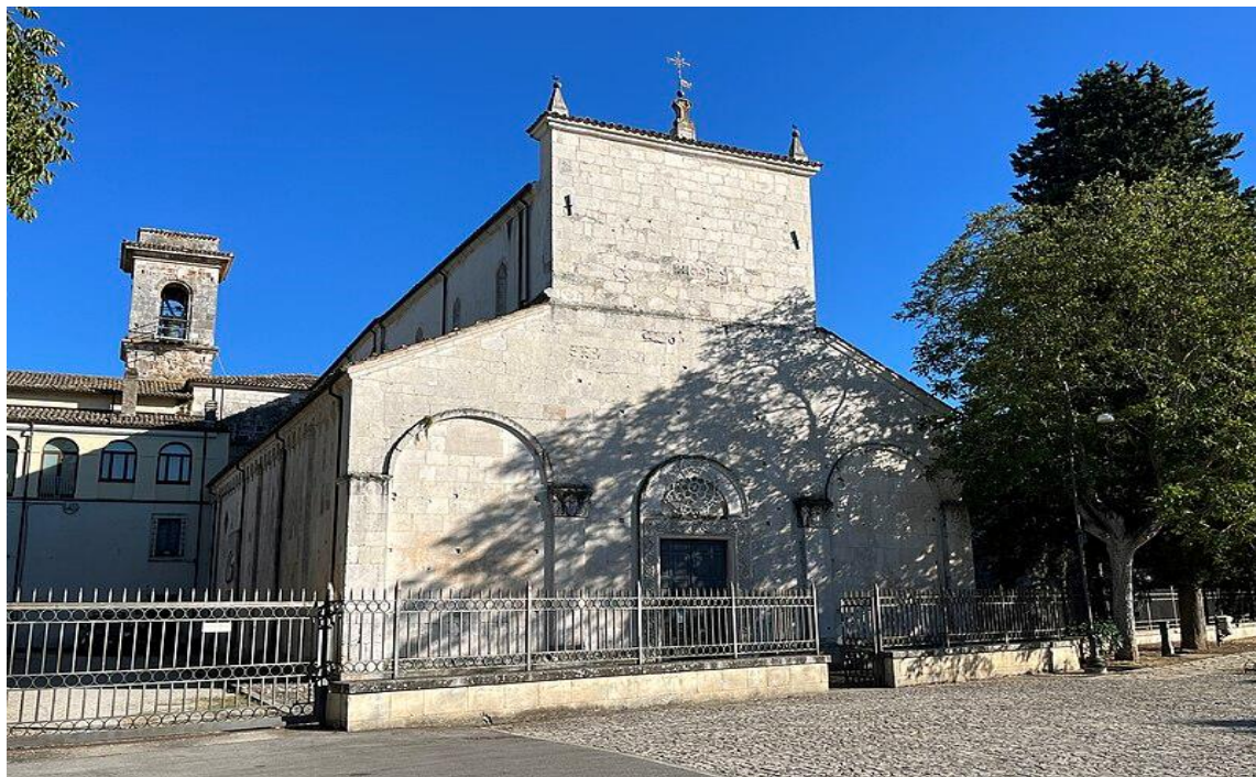
Chiesa di san Pelino in Corfinio