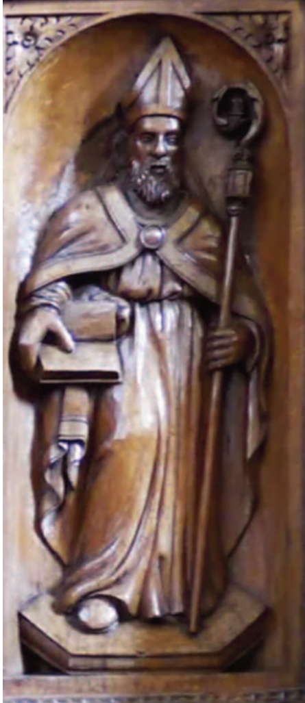
LE IMMAGINI Sopra la statua lignea di san Leucio nel coro ligneo della cattedrale

Tale inquadramento storico di Pelino – che fu originalmente proposto e spiegato da Giacomo Carito in "Gli arcivescovi di Brindisi sino al 674", pubblicato in 'Parola e storia' del 2007 – riformula i vari precedenti