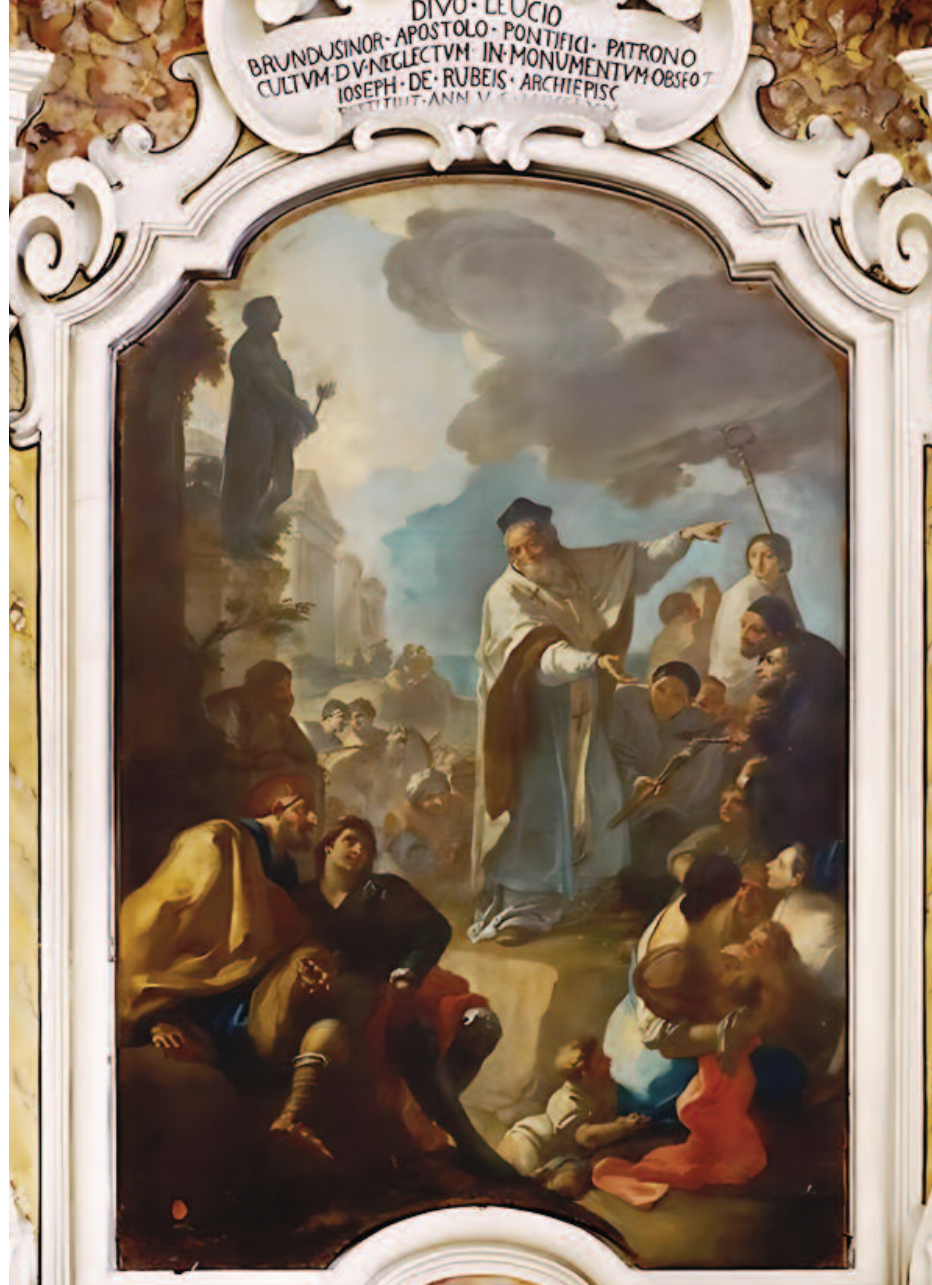
LE IMMAGINI Sopra San Leucio che predica al popolo - Dipinto settecentesco di Oronzo Tiso nella cattedrale, a destra la tomba di San Pelino nella concattedrale di Corfinio

«L'episcopato di Pelino va inquadrato nella temperie culturale del VII secolo. Tale nuovo riferimento cronologico, che è più attendibile rispetto a quello tradizionale che colloca l'episcopato peliniano nel IV secolo, rende piena comprensione della biografia del santo. Pelino, monaco basiliano formatosi in Durazzo – dove era nato da Arcadio e Safira – si trasferisce in Brindisi, in uno coi sirî Gorgonio e Sebastio e col suo discepolo Ciprio, in quanto non aderente al Tipo ossia all'editto dogmatico voluto dall'imperatore bizantino Costante II nel 648. Durante l'anno successivo, il pontefice Martino scomunica gli autori della nuova eresia; il papa deve, per questo, subire l'arresto, la deportazione a Costantinopoli e l'esilio a Cherson in Crimea, ove muore fra il 655 e il 656. Ferme opposizioni al Tipo si ebbero anche in oriente; Massimo il Confessore, maggiore fra i teologi greci del periodo, esiliato nella Lazia, è ucciso nel 662. Pelino, coi suoi compagni, è anch'egli difensore dell'ortodossia, e in Brindisi, i cui vescovi venivano confermati da Roma, pensa di trovare un asilo sicuro. Deve tuttavia accorgersi che non è così; il vescovo Aproculus, o Proculus, pare sulle posizioni concilianti che già erano state proprie del pontefice Onorio I. L'arrivo dei profughi albanesi, su posizioni chiaramente molto radicali, non consente tuttavia una politica di mediazione. Pelino spinge su posizioni chiare in difesa dell'ortodossia. Proculus,