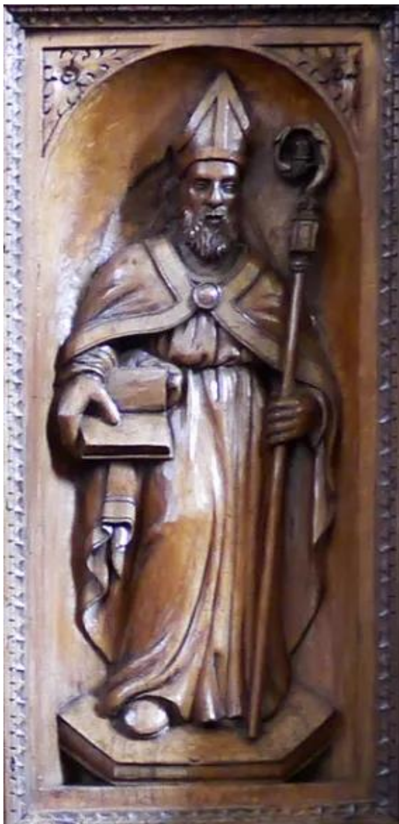
Statua lignea di san Leucio nel coro ligneo della cattedrale