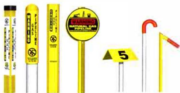
From left to right: TriView™ Marker, Dome Marker, Flat Marker, Round Marker, Aerial Marker, Casing Vent Markers.

Although not present in certain areas, these can be found at road crossings, fence lines, and street intersections. The markers display the product transported in the line, the name of the pipeline operator, and a telephone number where the operator can be reached in the event of an emergency.