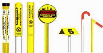
De izquierda a derecha: Marcador TriView™, Marcador Domo, Marcador Plano, Marcador Redondo, Marcador Aéreo, Marcadores de Tubos de Ventilación.

Aunque no siempre están presentes en ciertas áreas, estos marcadores se pueden encontrar en los cruces de ferrocarriles, las cercas y en las intersecciones de calles. Los marcadores muestran el producto que es transportado en la línea, el nombre del operador de la línea de tuberías y un número de teléfono donde puede contactar al operador en el caso de una emergencia.