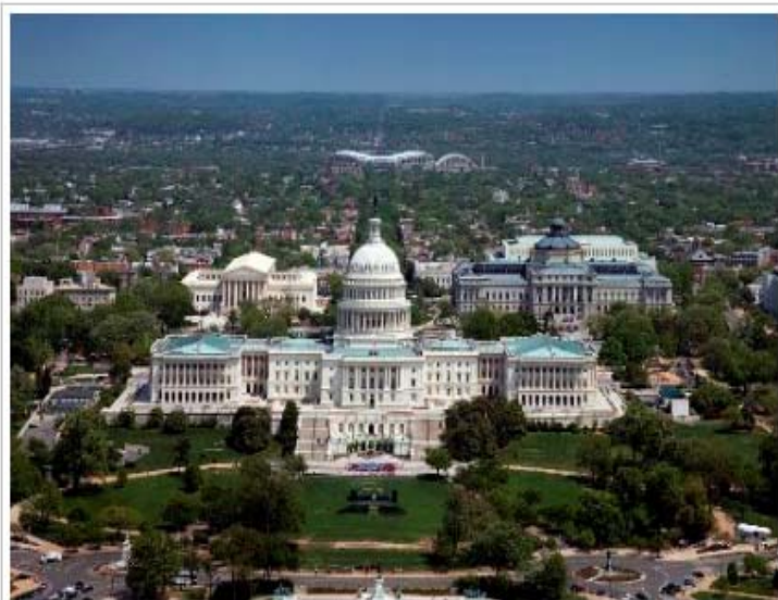
Congreso de Estados Unidos