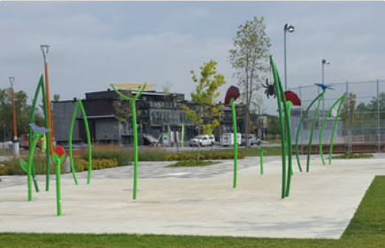
Parcs Pierre-Mercure + du Boisé