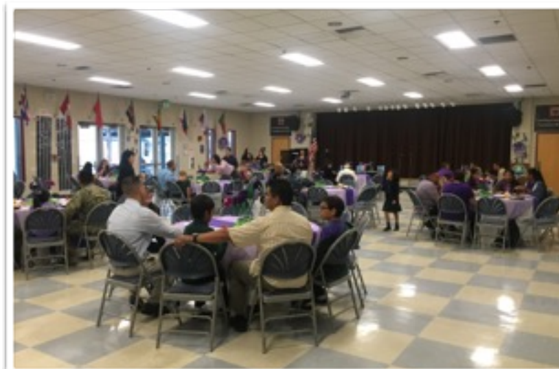
Chula Vista Learning Community Charter School Reconoce Nuestras Familias Militares