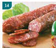
14 Auntie Claire(熟)意大利 辣肉腸(牛肉) 約500g