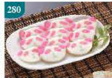
280 小浣熊日式魚蛋片 約300g/約28件 零售價：$37 會員價$26