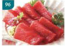
96 原件吞拿魚刺身 約300g-500g 零售價：$198 會員價$148