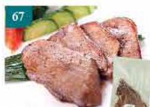
67 優質熟咸牛腩(切片) 醬油漬 約500g