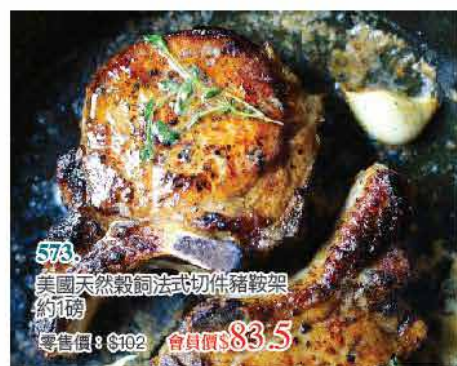
573 美國天然穀飼法式切件豬鞍架 約1磅