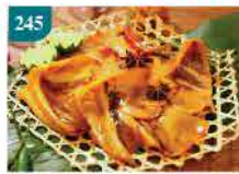
245 咖哩原隻魷魚翼 1磅/約3-4小件 零售價：$38 會員價$36