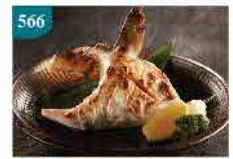
566 日本大油甘魚餃 2-3件/約300g 零售價：$82 會員價$68.5