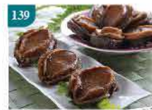
139 日式焗煮鮑魚 約150g/5件 零售價：$152 會員價$98