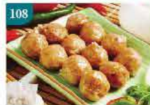
108 豬骨濃汁貢丸 約454g 零售價：$62 會員價$43