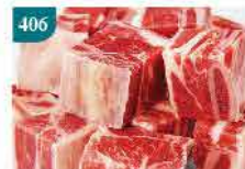
406 日本鹿兒島一口豚 約500g