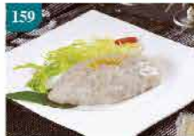
159 金牌蝦滑(香港製造) 約150g 零售價：$43 會員價$38