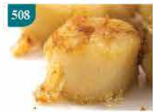
508 日本煮食用帶子(需熟食) 約1kg/U-10 零售價：$248 會員價$198