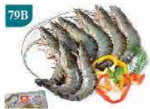
79B 越南有頭虎蝦(L) 約300g 零售價：$78 會員價$48