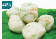
445A 翡翠杏菇球 約300g 零售價：$34 會員價$26