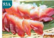
93A 北寄貝刺身 約160g 零售價：$98 會員價$62