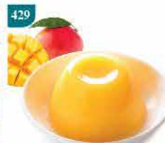
429 台灣愛文芒果 "鮮果肉" 布丁 約130g/1杯 零售價：$18.5 會員價$15