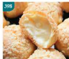
398 日本忌廉泡芙 12件 零售價：$32 會員價$21