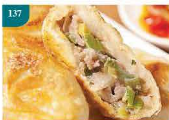
137 台灣宜蘭蔥肉餡餅 約900g/30件