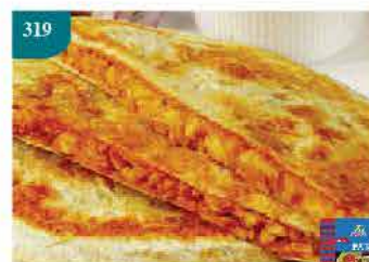
319 馬來西亞Kawan咖喱鍋餅 約400g/4片