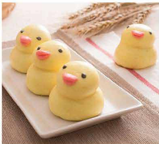
570. 趣緻小鴨包(芝麻餡) 600g±5% 10個