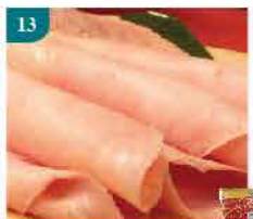
13 Auntie Claire火雞吐司 火腿片 約500g