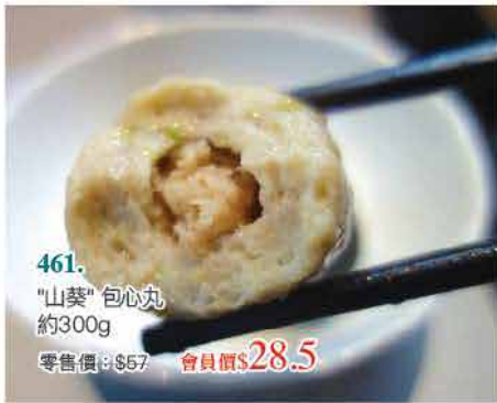
461. "山葵" 包心丸 約300g 零售價：$57 會員價$28.5