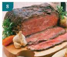
8 (熟)煙燻燒牛肉(切片) 約500g