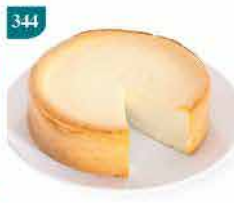
344 北海道焗燉蛋芝士蛋糕 約350g 零售價：$138 會員價$98