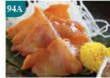
94A 赤貝刺身 20片/約120g 零售價：$56 會員價$38