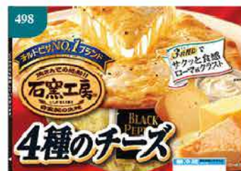
498 四種芝士披薩 約185g/直徑約23 cm