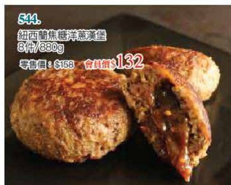
544. 紐西蘭蔗糖洋蔥漢堡 8件/880g