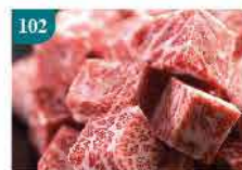
102 日本霜降一口牛肉 約454g