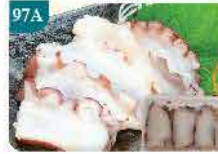
97A 八爪魚刺身 約20片 零售價：$32 會員價$24