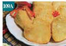
109A 心形魚肉豆腐 約500g/約30件 零售價：$68 會員價$40