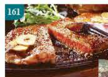
161 美國黑毛安格斯Black Canyon 肉眼牛扒 約8oz