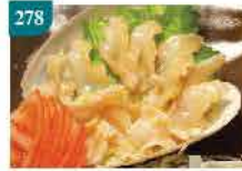
278 馬刀貝刺身片 約120g/約20件 零售價：$69 會員價$38