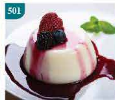
501 意大利Panna Cotta精品 忌廉奶凍 2件裝/200g 零售價：$38 會員價$28.5