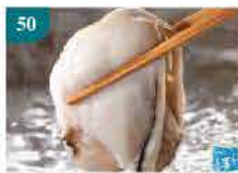
50 日本廣島蠔(供烹調用) Size 2L/1Kg/26-35隻 零售價：$136 會員價$152