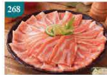
268 荷蘭帶皮豬腩片 約250g 零售價：$37 會員價$24