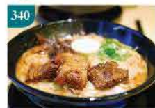
340 日式味附豬軟骨(熟) 約500g