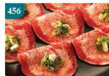
456 巴西牛腩片(薄切) 約105-110g