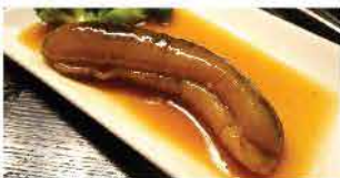
571. 南美急凍天然海參 約1磅 零售價：$132 會員價$96