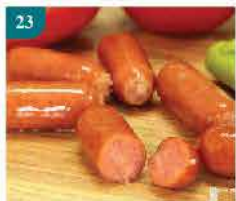
23 迷你芝士腸 約454g