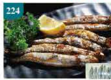
224 加拿大優質多春魚 約8條 零售價：$23 會員價$16