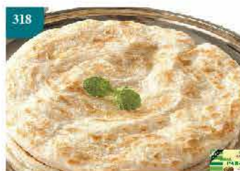
318 馬來西亞Kawan油酥餅(原味) (黃金烙餅) 約400g/5片