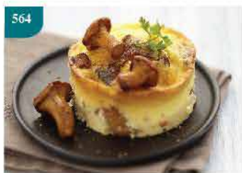
564 法國烤蘑菇批 2件裝