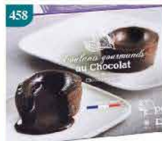
458 法國心太軟蛋糕 約100g/2件 零售價：$68 會員價$38