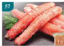
57 大吉松葉蟹棒 約270g/約30件 零售價：$62 會員價$38