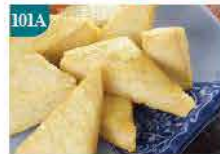
101A 新界鮮味炸魚角 約300g 零售價：$36 會員價$26