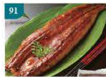
91 日式蒲燒鰻魚 約280g-300g 零售價：$108 會員價$79.5