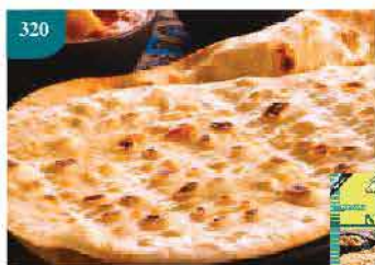
320 馬來西亞Kawan原味印度 烤包 約425g/5片