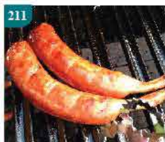
211 日式雞骨豬肉腸 約200g/5條