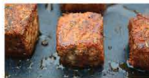
583. 精選一口吞拿魚柳(須熟食) 約1kg 零售價：$52.5 會員價$46.5