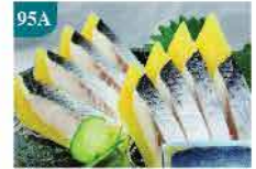
95A 希靈魚子刺身 約120g 零售價：$38.5 會員價$27