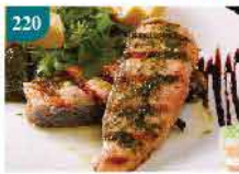
220 挪威有機連皮三文魚柳 約500g/約4pcs 零售價：$140 會員價$108