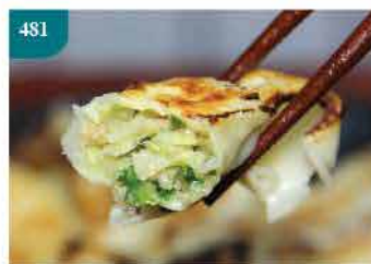
481 圓木圍水餃 約300g