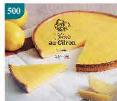
500 法國清香檸檬撻 約450g 零售價：$89 會員價$68.5