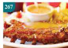
267 美國IBP豬仔骨(恐龍骨) 約700g/約6-8支骨