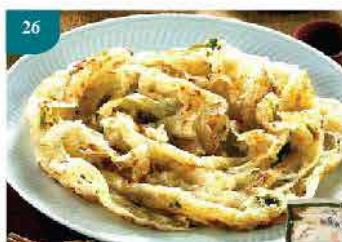
26 台灣蔥手抓餅 約680g 一包5塊/每塊直徑約8吋