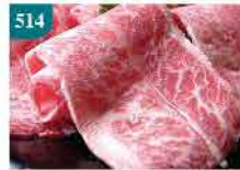
514 美國安格斯肥牛片 約1磅 零售價：$82 會員價$68