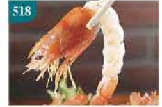
518 赤蝦L4 (去殼有頭) (可刺身用)約10隻 零售價：$68 會員價$46