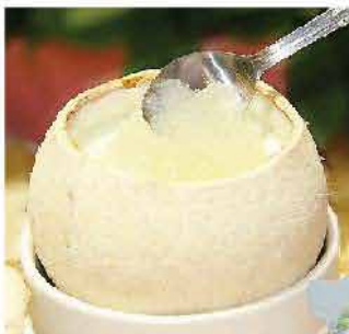
263. 泰國原個海 椰王凍 約220g 零售價：$41.5 會員價$38.5