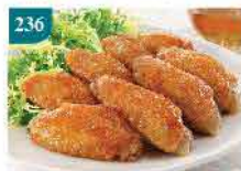
236 雞中翼(香辣) 1磅/約10-12隻