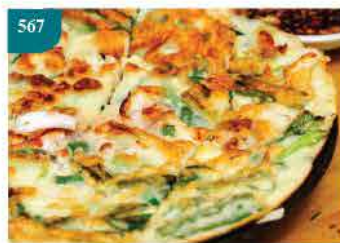
567 韓國海鮮薄餅 2件裝 約420g/約12.5cm x 17cm