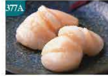
377A 日本帶子刺身 約250g/約16-18隻 零售價：$128 會員價$98