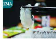
124A 泰式生蠔刺身 約20件 零售價：$69.5 會員價$21