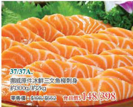
37/37A. 挪威原件冰鮮三文魚柳刺身 約300g/約2kg 零售價：$198/$562 會員價$148/398