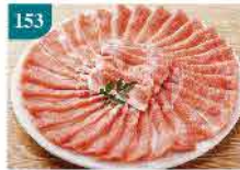
153 澳洲一級羊肉片 約454g/約1磅 零售價：$98 會員價$68