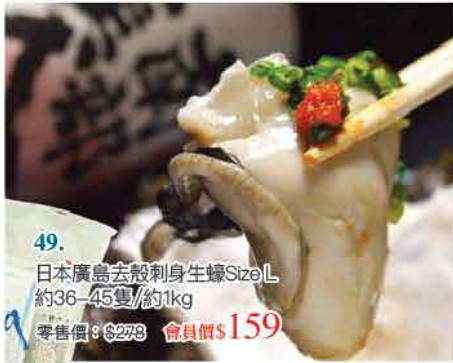
49. 日本廣島去殼刺身生蠔Size L 約36-45隻/約1kg 零售價：$278 會員價$159