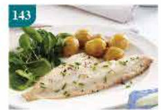
143 澳洲一級白肉龍利柳 (稔魚柳) 約480g 零售價：$68 會員價$38