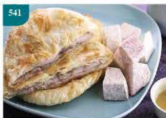
541 台灣大甲芋頭煎餅 約480/4件