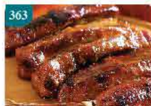
363 美國BBQ醬燒豬仔骨(全條) 約1.3kg