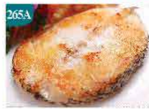
265A 美國白鱈魚扒 約300g/約2-3件 零售價：$182 會員價$105