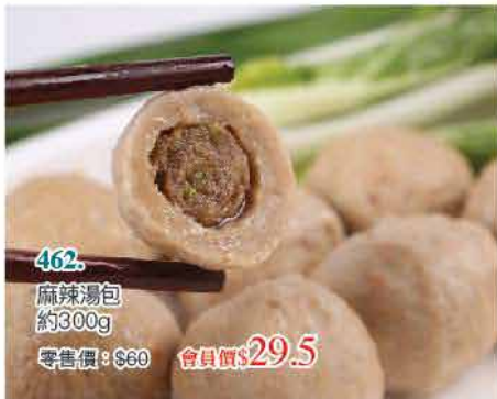
462. 麻辣湯包 約300g 零售價：$60 會員價$29.5