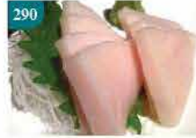
290 原件劍魚腩刺身 約300g-500g 零售價：$88 會員價$65