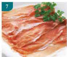
7 (熟)煙燻油花牛肉片 約500g