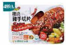
489A 韓式辣燒豬手切片 約250g