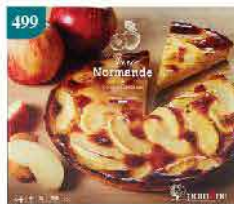
499 法國諾曼第吉士忌廉蘋果批 約450g 零售價：$98 會員價$74.5