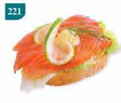
221 挪威煙燻三文魚(鮭魚)切片 約500g