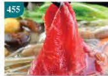
455 美國安格斯牛肩胛片 約300g 零售價：$70 會員價$48