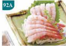
92A 甜蝦刺身 30隻裝 零售價：$68 會員價$36