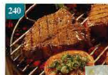
240 豬扒(勁著) 1磅裝/約3-4件