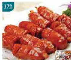
172 台灣小香腸-原味 約270g/6條