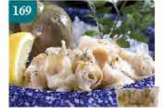
169 加拿大翡翠螺XL加大碼 約500g/約6-8隻 零售價：$72 會員價$48