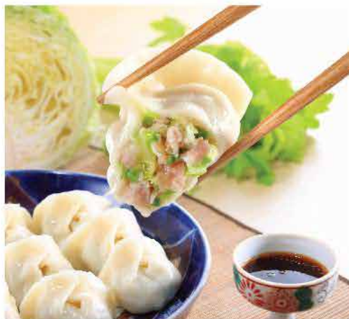
580. 台灣手工高麗菜豬肉餃 約720g 約40粒