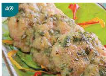
469 家鄉小菜墨魚餅(已調味) 約300g