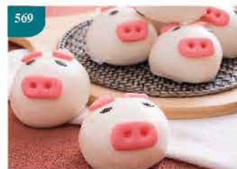
569 開心小豬包(芋泥餡) 600g±5%/包10個