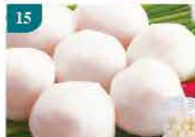
15 馬來彈口鮮魚丸 約500g 零售價：$37.8 會員價$28