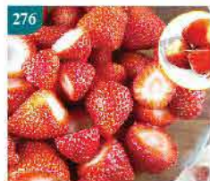
276 日本原個草莓雪葩 約6粒 零售價：$56.5 會員價$39.5