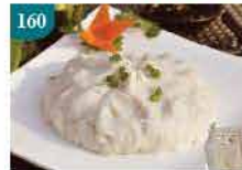
160 金牌墨魚滑(香港製造) 約150g 零售價：$43 會員價$38