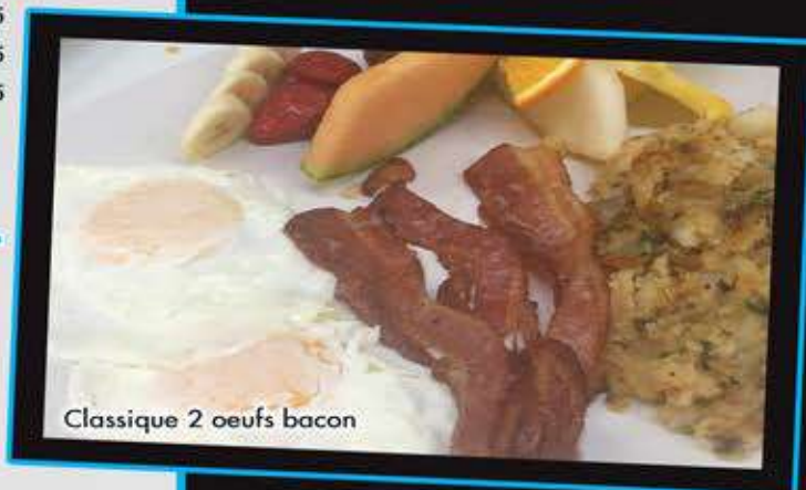
Classique 2 oeufs bacon