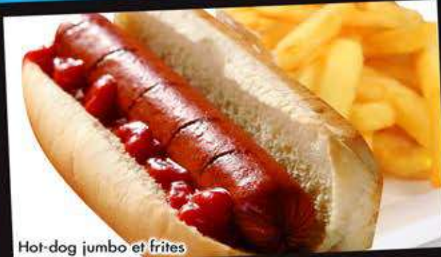
Hot-dog jumbo et frites