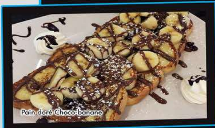
Pain doré Choco-banane