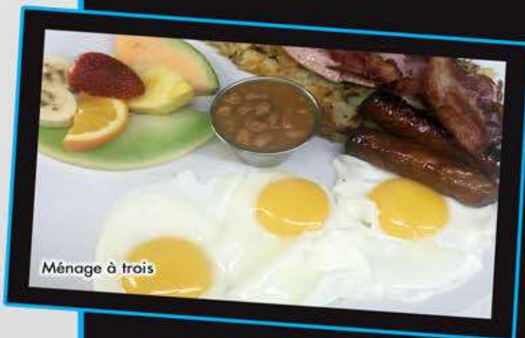
Ménagement à trois

Bagel ouvert composé de 2 oeufs, 2 fromages cheddar, bacon ou jambon, fèves au lard, servis avec fruits frais, pommes de terre maison et café