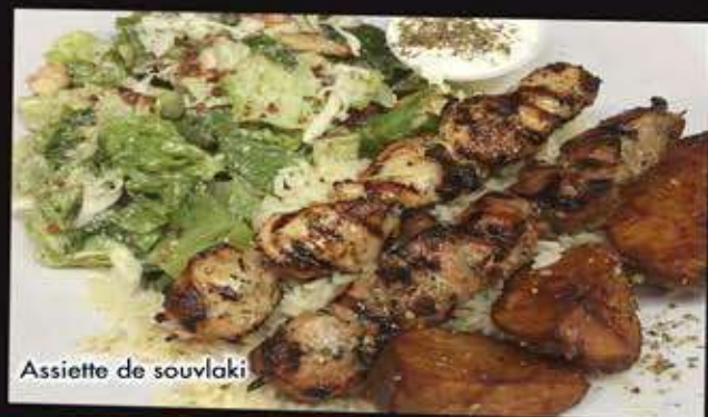
Assiette de souvlaki