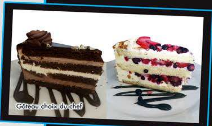
Gâteau choix du chef