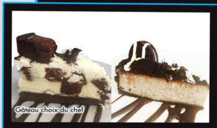
Gâteau choix du chef