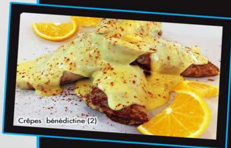
Crêpes bédicotine (2)