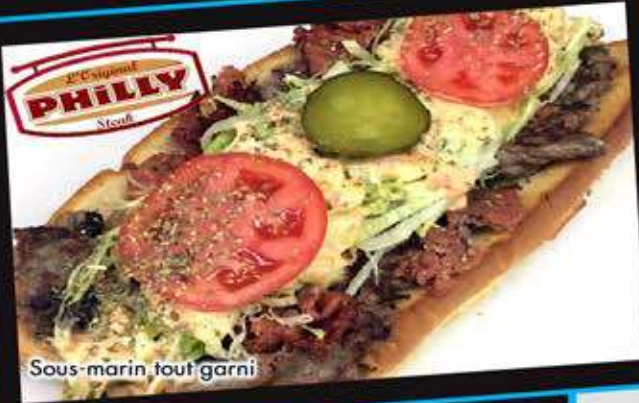
Sous-marin tout garni