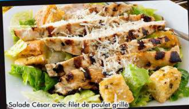
Salade César avec filet de poulet grillé