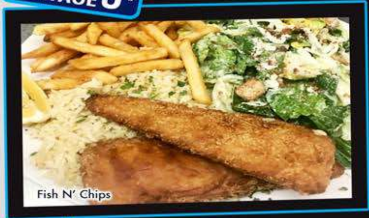
Fish N' Chips

Ajoutez un choix de salade (du chef ou César) Extra 3.95