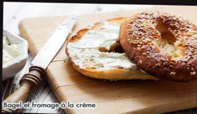
Bagel et fromage à la crème