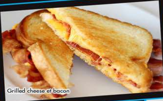
Grilled cheese et bacon