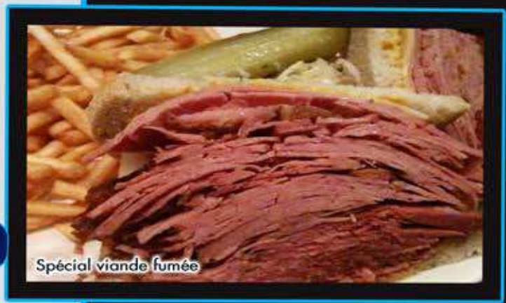
Spécial viande fumée

Club Sandwich (bacon, tomate, salade et mayo) 17 95 Club Sandwich pour 2 (bacon, tomate, salade et mayo) 20 95 Club Sandwich Viande Fumée 21 95 (Fromage Suisse, bacon, tomate, salade et mayo) Club du Vendredi (fromage, oeuf, tomate, salade et mayo) 17 95 Club Le Cartier 20 95 (poulet grillé, bacon, fromage Suisse, tomate, salade et mayo) Assiette de tendre de poulet avec riz (4) 18 95 Les assiettes ci-dessus sont servies avec salade de choux, frites et sauce B.BQ. Sandwich au poulet chaud 18 95 Servies avec pois, frites et sauce B.BQ.