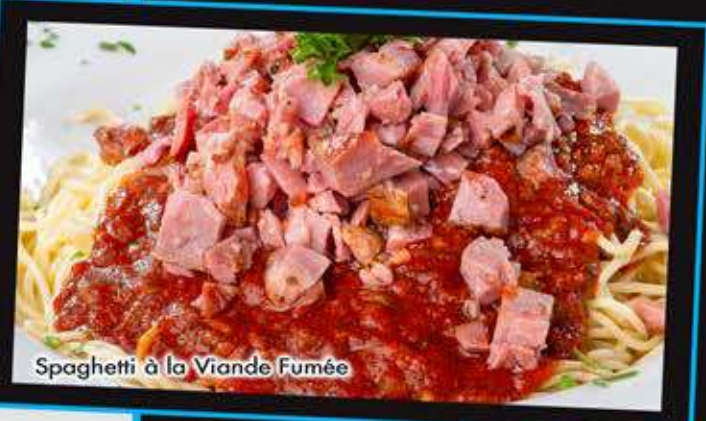
Spaghetti à la Viande Fumée