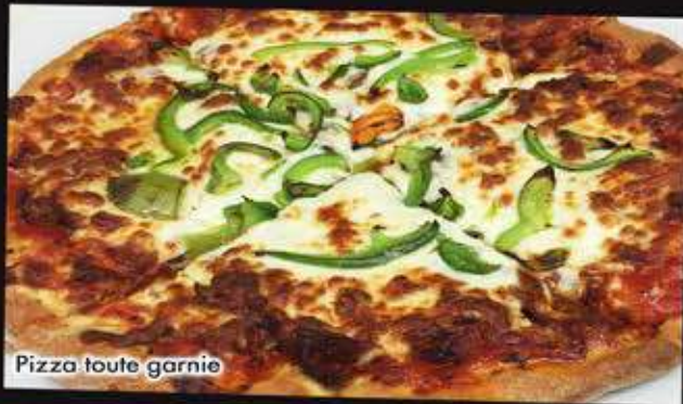
Pizza toute garnie