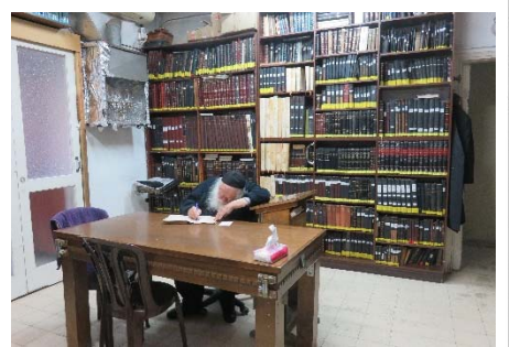
השולחן נקי מכל חפץ מיותר. רבינו כותב חידושי תורה

מובן, כי אם צריך השולחן מתמלא בספרים וחפצים הנצרכים, כי כשצריך - הסדר הוא שהשולחן יהיה עמוס... אבל בשגרת החיים כל דבר דבור על אופנו. סדר זה, אינו משום 'היגיינה' או שהוא 'אסטניס' וכדומה, אלא הוא כלי נצרך לעבודת ה' בתורה ובתפילה, מי שאינו מסודר מתבלבל ומבלבל בקלות. בהנהגה זו השתמש רבינו גם בחינוך הילדים, אך בל נקדים את המאוחר.