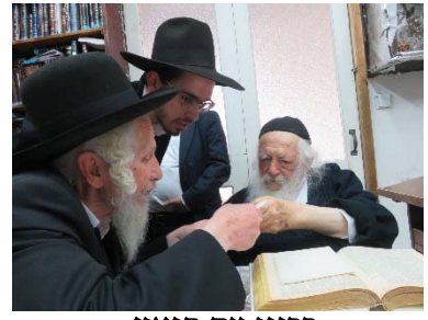
רבינו עם הגאון רבי בצלאל פכטהלט שליט"א

בימינו - הדבר נראה משונה קצת, וכי מתמיד כמו רבי חיים קניבסקי "בזבז את הזמן" כדי ללכת להעיר חברותא? אבל ההיפך הוא הנכון: רבינו ידע את הסוד. הקביעות, והזמן העקבי, שוים את כל המאמצים. מוטב לו לטרוח ללכת עד לבית החברותא, כדי שהקביעות תימשך במועדה בלי איחורים וחסורים.