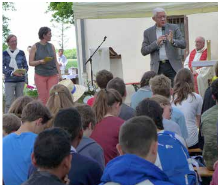
Mgr Ravel s'adresse aux jeunes Pélé jeunes - ND du Chêne - Juin 2017

3. La pastorale de la jeunesse : Mgr Ravel propose des étapes de pédagogie concrète pour un engagement pastoral pratique et réaliste répondant à la démarche synodale lancée par le pape François pour les prochains mois.