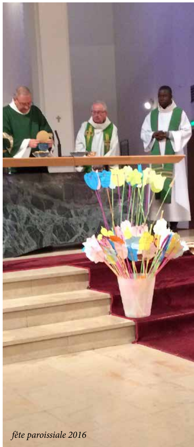
fête paroissiale 2016