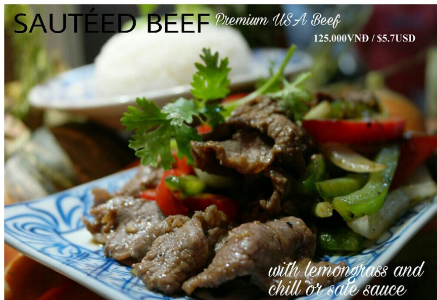
Bò xào sả ớt hoặc sa tế - 125.000VND / $5.7USD

Free delivery 08 39 101 277 or www.bloom-saigon.com/delivery