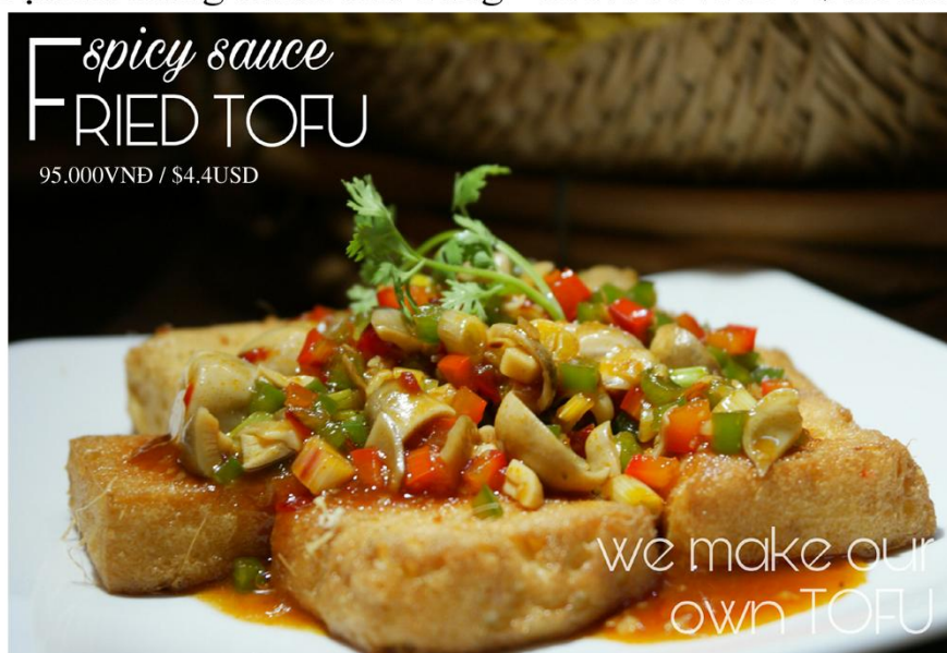
Đậu hủ sốt cay - 95.000VNĐ / $4.4USD

Free delivery 08 39 101 277 or www.bloom-saigon.com/delivery