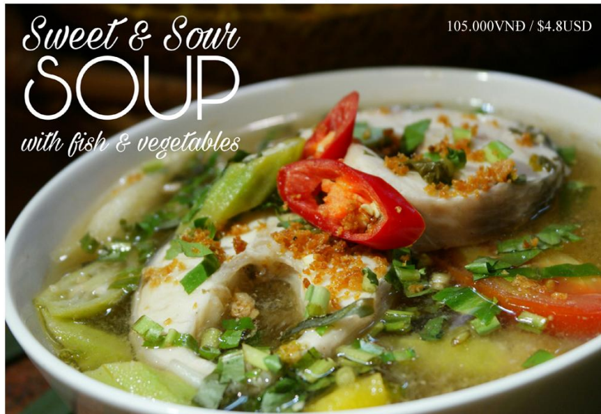
Canh chua cá *GF (1 tô) - 105.000VND / $4.8USD