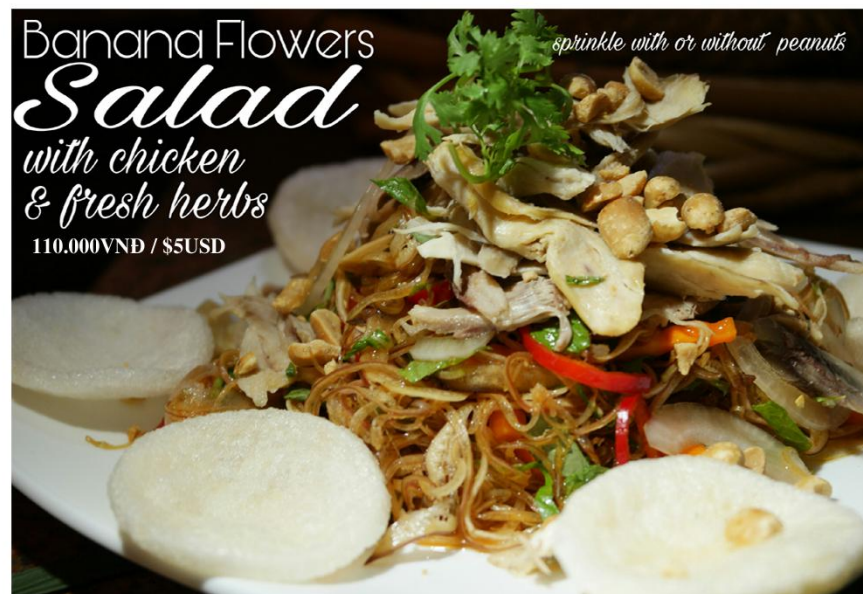
Gỏi gà bắp chuối bào - 110.000VND / $5USD

Free delivery 08 39 101 277 or www.bloom-saigon.com/delivery