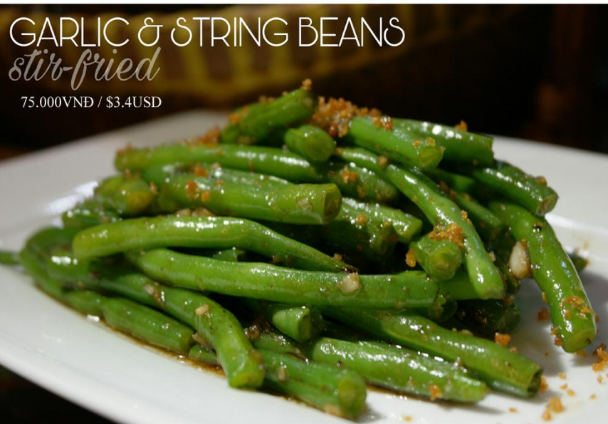
Đậu que xào tỏi *GF - 75.000VNĐ / $3.4USD