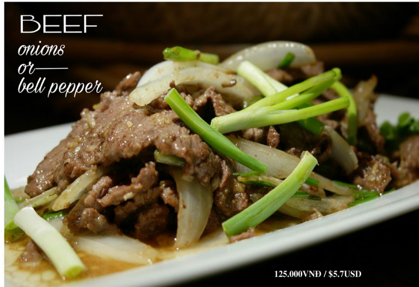
Bò xào hành tây hoặc ớt Đà Lạt - 125.000VND / $5.7USD