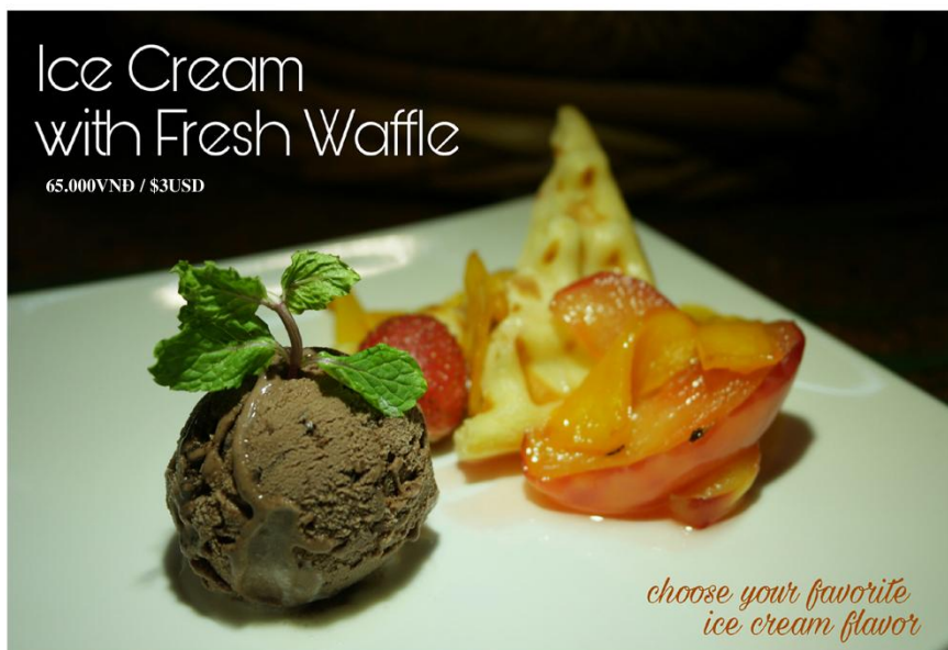
Bánh waffle + kem (chọn kem) - 65.000VND / $3USD