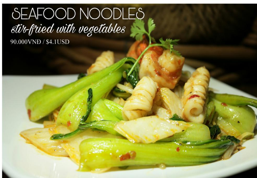
Mì xào hải sản *GF - 90.000VND / $4.1USD