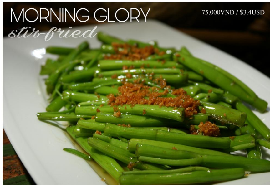
Rau muống xào tỏi *GF - 75.000VNĐ / $3.4USD