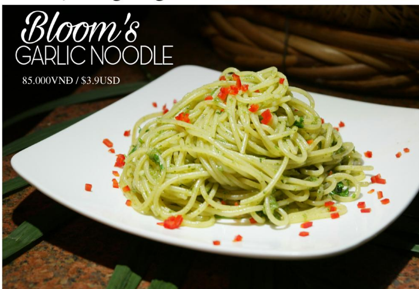
Mì Bloom *GF - 85.000VND / $3.9USD

Free delivery 08 39 101 277 or www.bloom-saigon.com/delivery