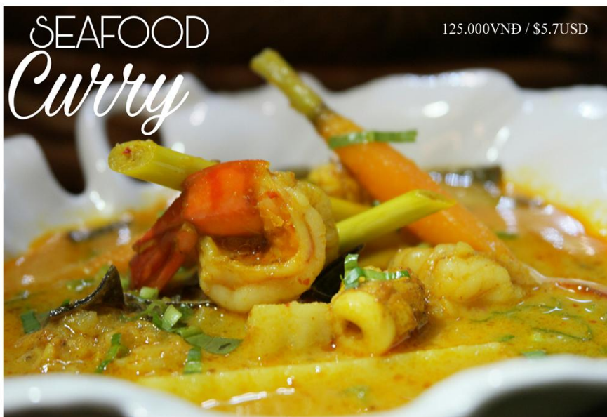
Cary hải sản - 125.000VND / $5.7USD

Free delivery 08 39 101 277 or www.bloom-saigon.com/delivery