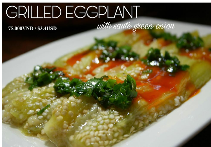
Cà tím nướng mỡ hành *GF - 75.000VNĐ / $3.4USD