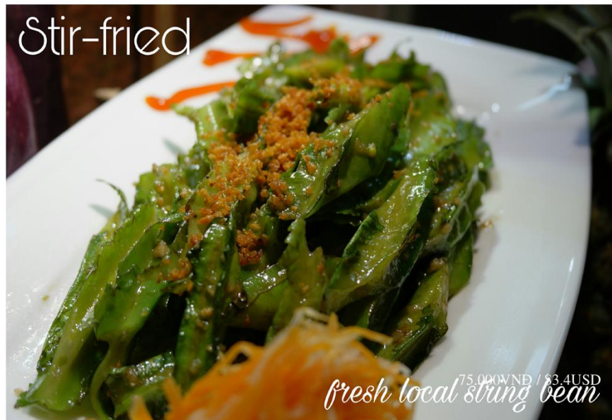
Đậu rồng xào tỏi *GF - 75.000VN / $3.4USD