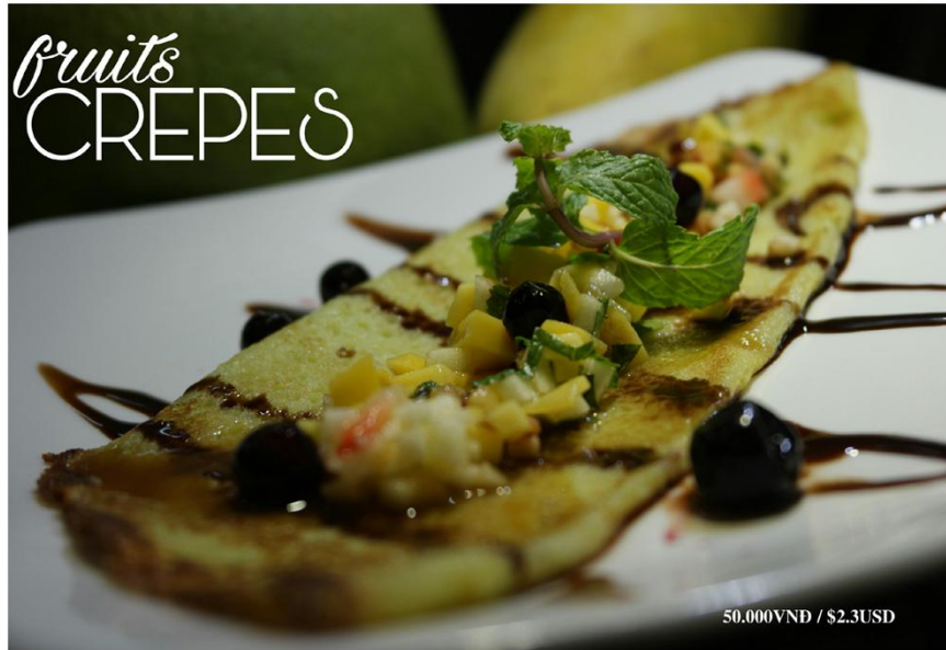
Bánh cuốn trái cây - 50.000VND / $2.3USD