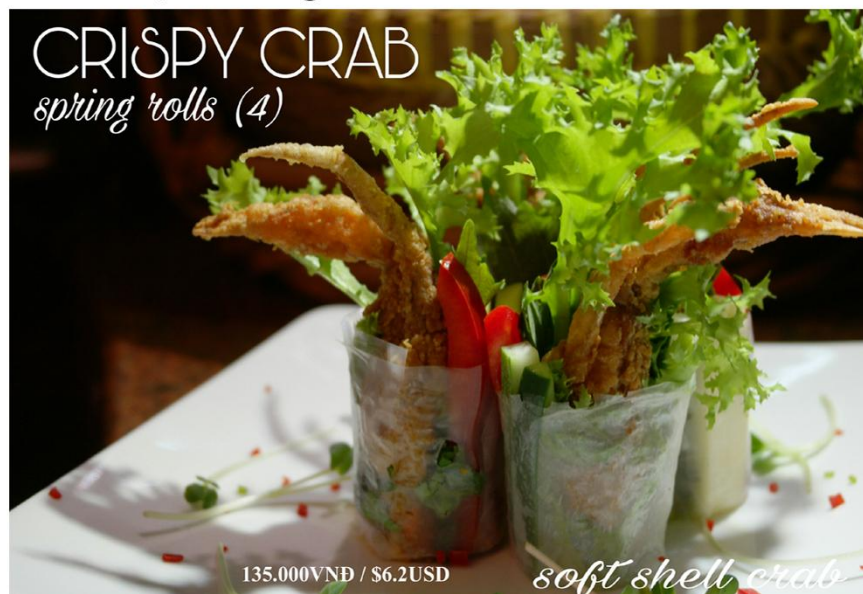
CRISPY CRAB spring rolls (4)