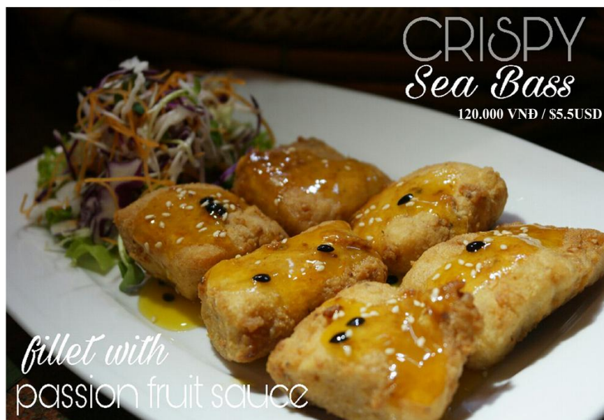
Cá chẻm sốt chanh dây - 120.000VNĐ / $5.5USD

Free delivery 08 39 101 277 or www.bloom-saigon.com/delivery