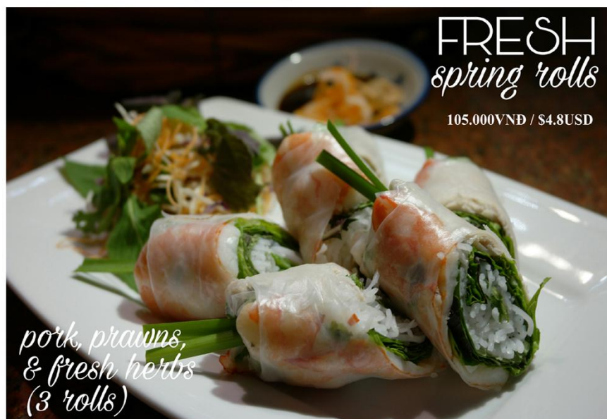
Gỏi cuốn tôm thịt (3 cuốn) *GF - 105.000VNĐ / $4.8USD

Free delivery 08 39 101 277 or www.bloom-saigon.com/delivery