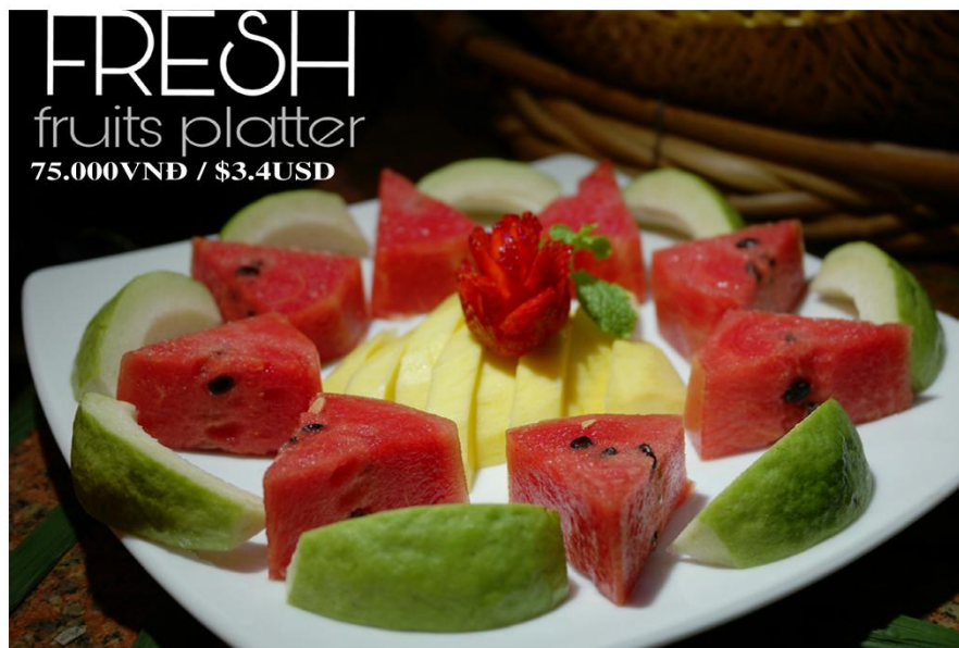
Đĩa trái cây - 75.000VNĐ / $3.4USD