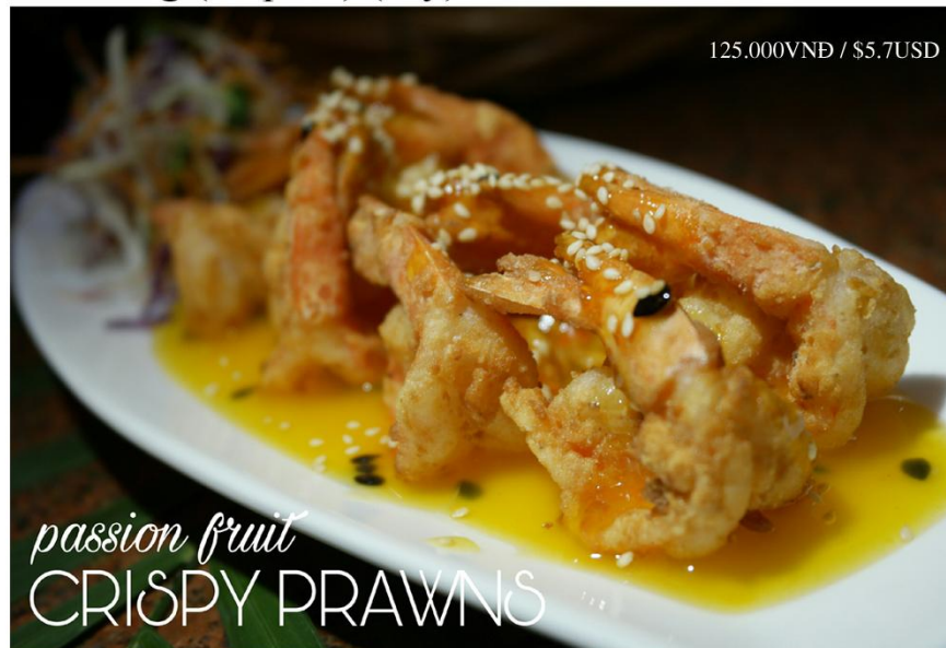
Tôm sốt chanh dây - 125.000VND / $5.7USD