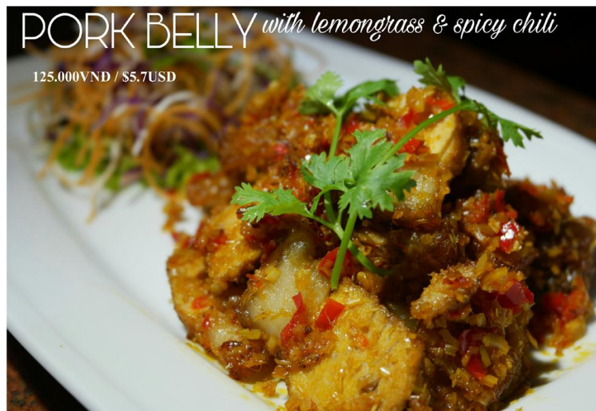
Ba rọi chiên sả ớt - 125.000VND / $5.7USD

Free delivery 08 39 101 277 or www.bloom-saigon.com/delivery