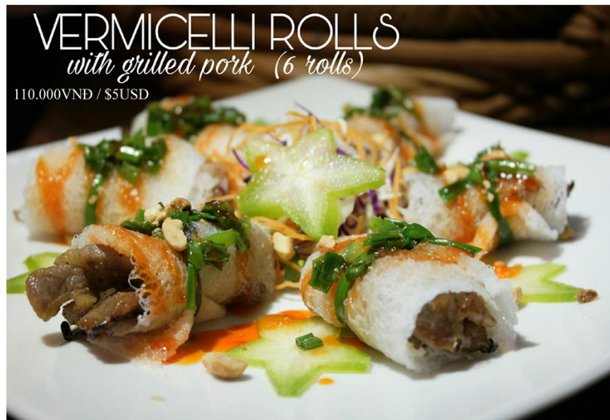
Bánh hỏi thịt nướng (6 cuốn) *GF - 110.000VND / $5USD