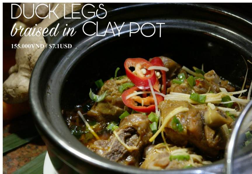
Vịt kho gừng *GF - 155.000VNĐ / $7.1USD