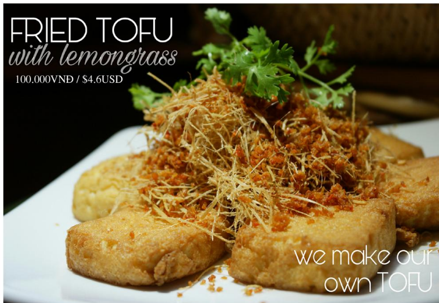
Đậu hủ trứng chiên sả ớt - 100.000VNĐ / $4.6USD