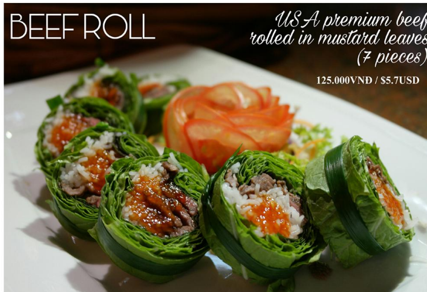
Bò cuốn cải bẹ xanh (7 miếng) *GF - 125.000VNĐ / $5.7USD