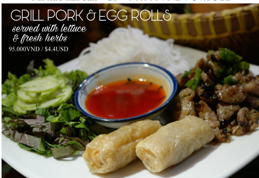
Bún thịt nướng chả giò *GF - 95.000VND / $4.4USD