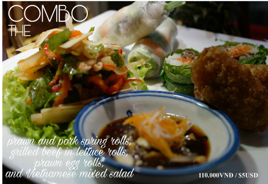
Chả giò, bò cuốn, gỏi cuốn, gỏi - 110.000VNĐ / $5USD