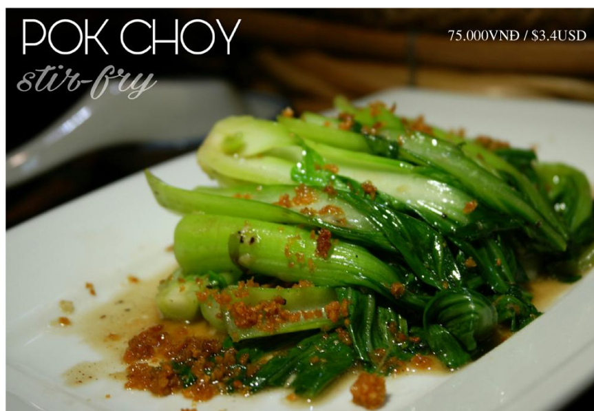
Cải thìa xào tỏi *GF - 75.000VNĐ / $3.4USD