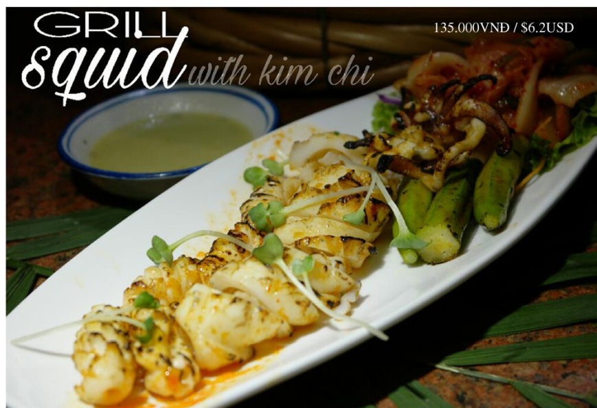
Mực nướng (20 phút) *GF - 135.000VND / $6.2USD

Free delivery 08 39 101 277 or www.bloom-saigon.com/delivery