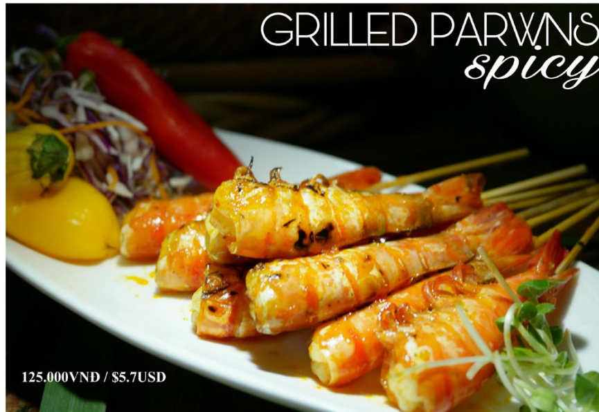
Tôm nướng (20 phút) (cay) *GF - 125.000VND / $5.7USD