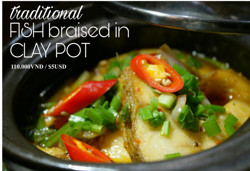
Cá lóc kho tộ *GF - 110.000VNĐ / $5USD