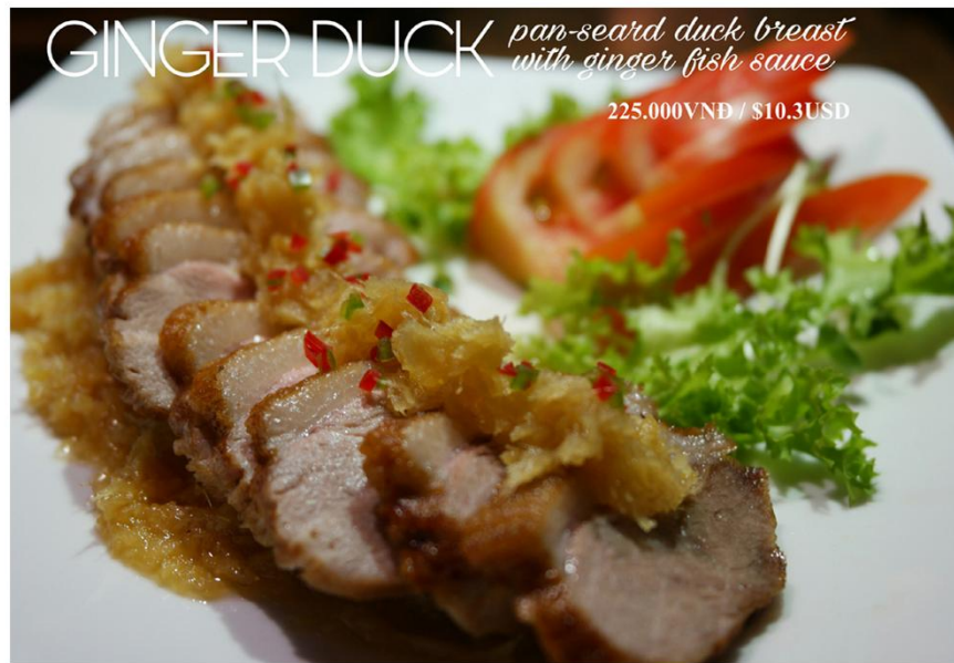
Ức vịt chiên nước mắm gừng *GF - 225.000VNĐ / $10.3USD