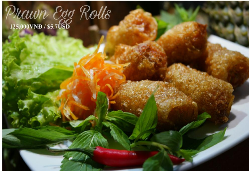
Prawn Egg Rolls 125.000VNĐ / $5.7USD