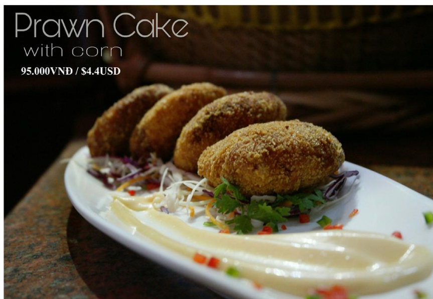
Bánh tôm với bắp (4 cái) 95.000VNĐ / $4.4USD