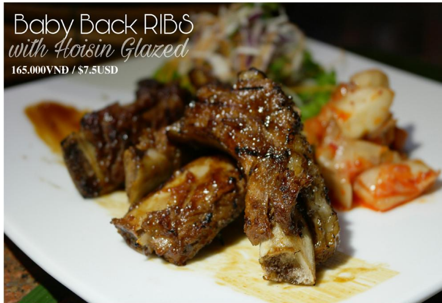
Sườn non nướng tương đen- 165.000VND / $7.5USD