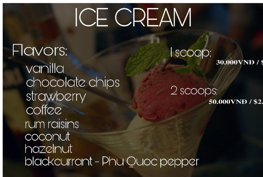
Kem (1 viên) - 30.000VNĐ / $1.4USD