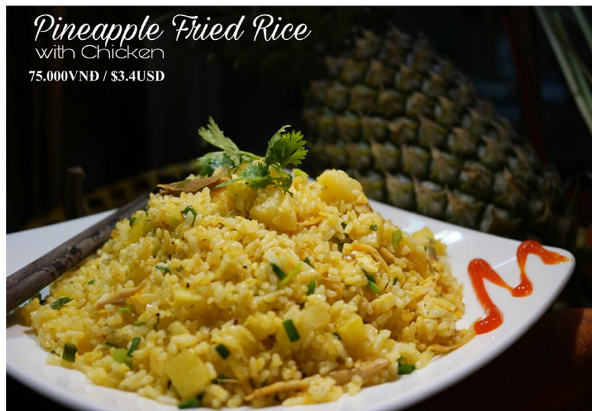
Cơm chiên thơm gà *GF - 75.000VND / $3.4USD