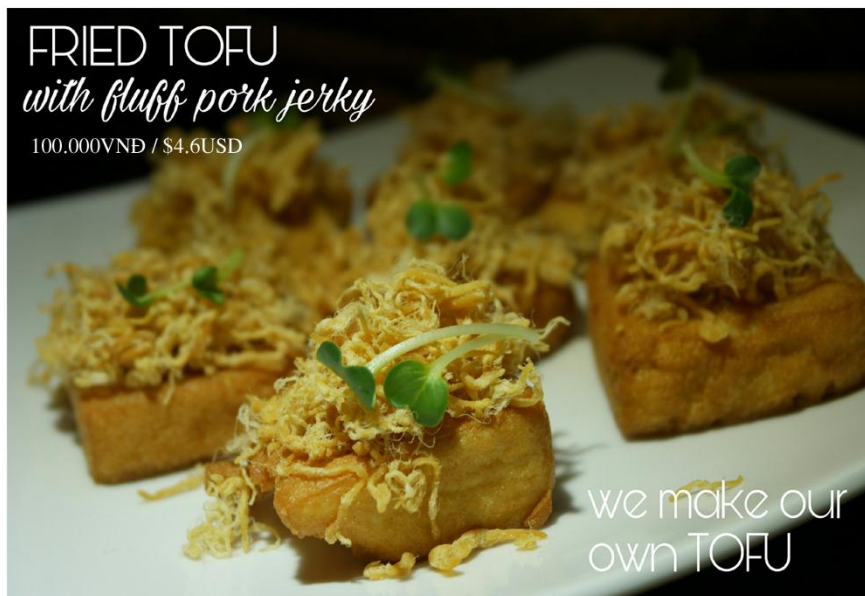
Đậu hủ trứng chiên chà bông - 100.000VNĐ / $4.6USD