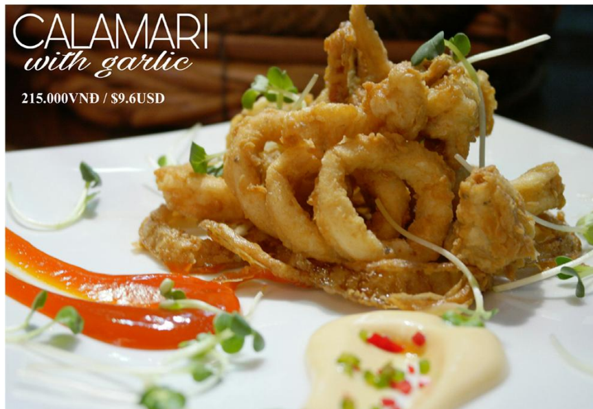
CALAMARI with garlic 215.000VNĐ / $9.6USD