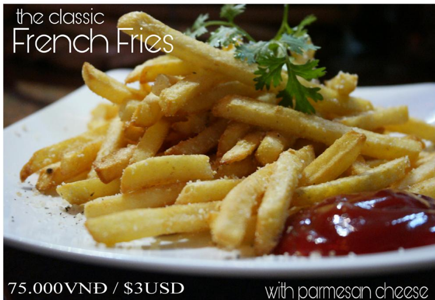
Khoai tây chiên*GF- 75.000VND / $3USD

Free delivery 08 39 101 277 or www.bloom-saigon.com/delivery