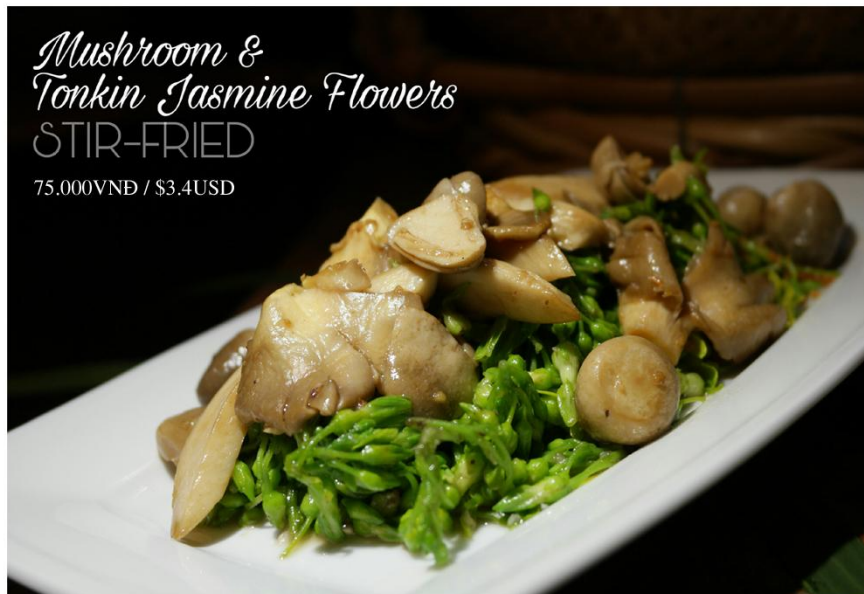
Thiên lý xào nấm *GF - 75.000VNĐ / $3.4USD