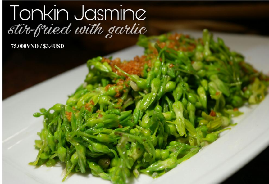
Thiên lý xào tỏi *GF - 75.000VN / $3.4USD