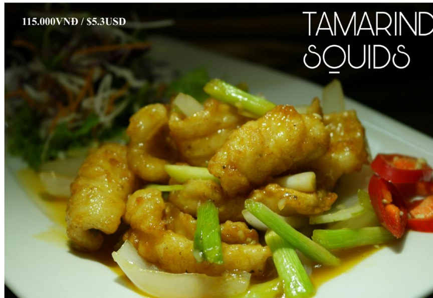
Mực sốt me - 115.000VND / $5.3USD