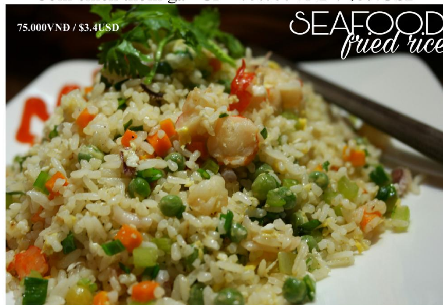
Cơm chiên hải sản *GF - 75.000VND / $3.4USD

Free delivery 08 39 101 277 or www.bloom-saigon.com/delivery