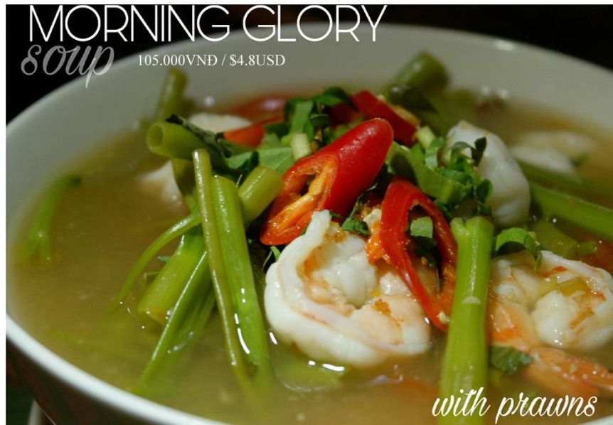
Canh chua rau muống tôm (1 tô) - 105.000VND / $4.8USD