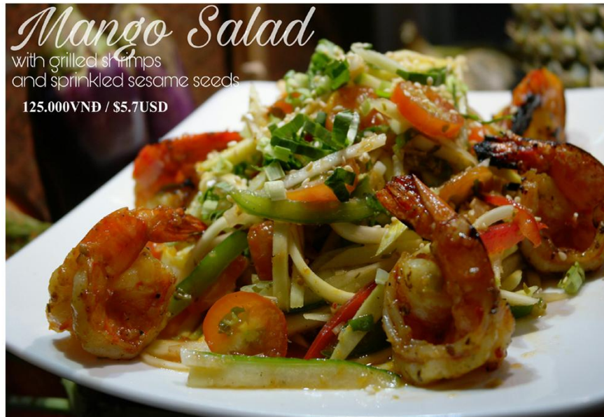
Gỏi xoài tôm nướng (6 con) - 125.000VND / $5.7USD