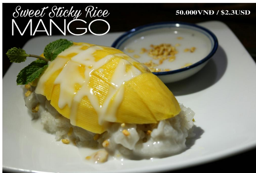
Xôi xoài - 50.000VNĐ / $2.3USD