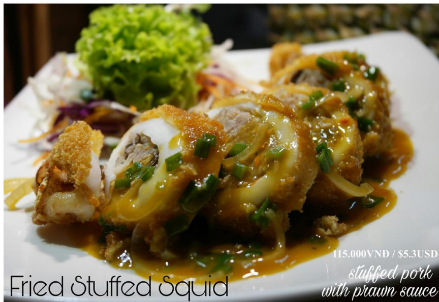
Mực nhồi thịt sốt tôm - 115.000VND / $5.3USD