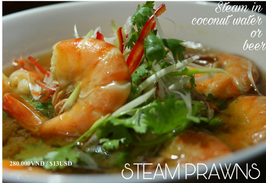
Tôm hấp bia hoặc dừa (0.5kg) *GF - 280.000VND / $13USD