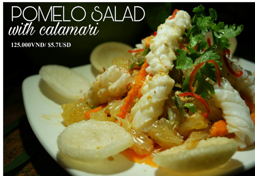
Gỏi bưởi mực - 125.000VND / $5.7USD