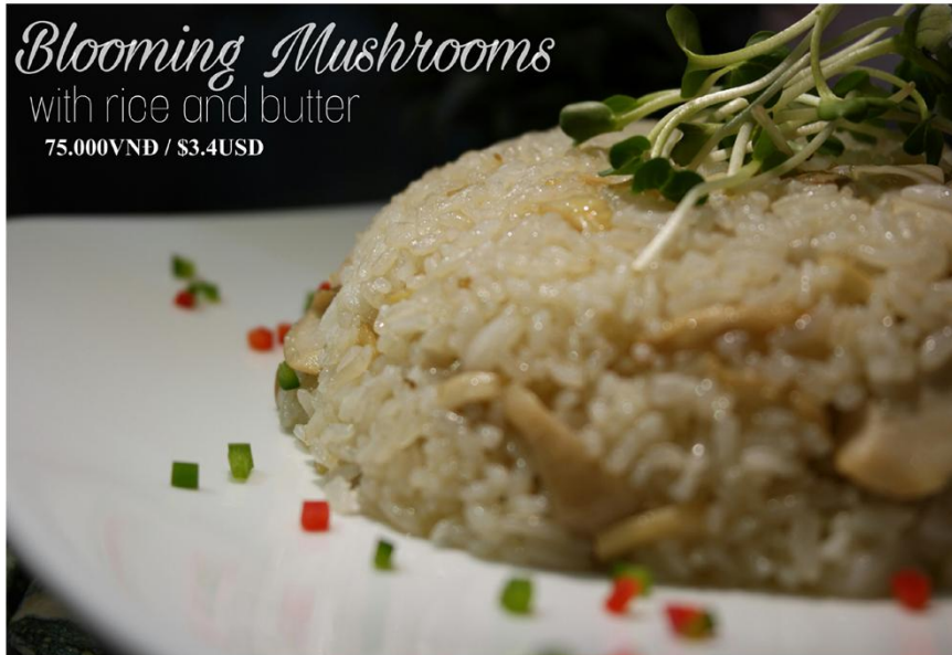
Cơm nấm *GF - 75.000VND / $3.4USD