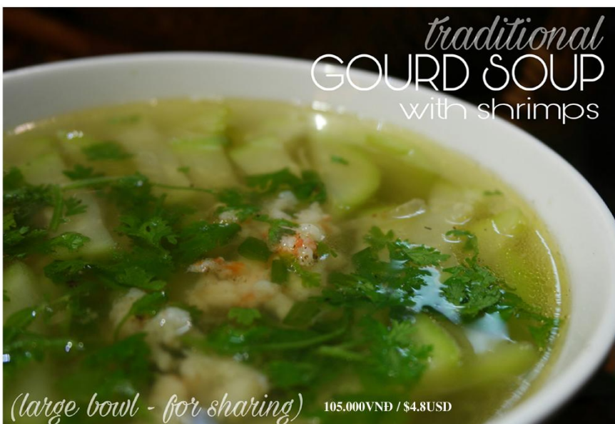
Canh bầu nấu tôm *GF (1 tô) - 105.000VND / $4.8USD

Free delivery 08 39 101 277 or www.bloom-saigon.com/delivery