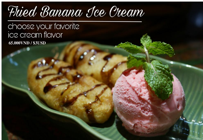
Chuối chiên + kem (chọn kem) - 65.000VND / $3USD