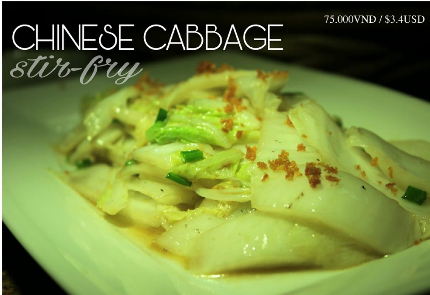
Cải thảo xào tỏi *GF - 75.000VNĐ / $3.4USD