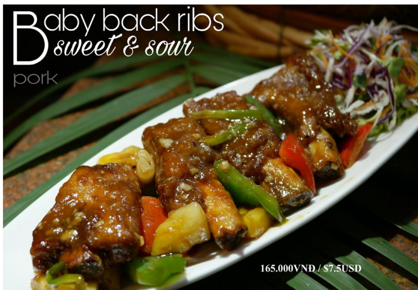
Baby back ribs sweet & sour pork

♥ Thịt kho trứng *GF - 145.000VND / $6.5USD