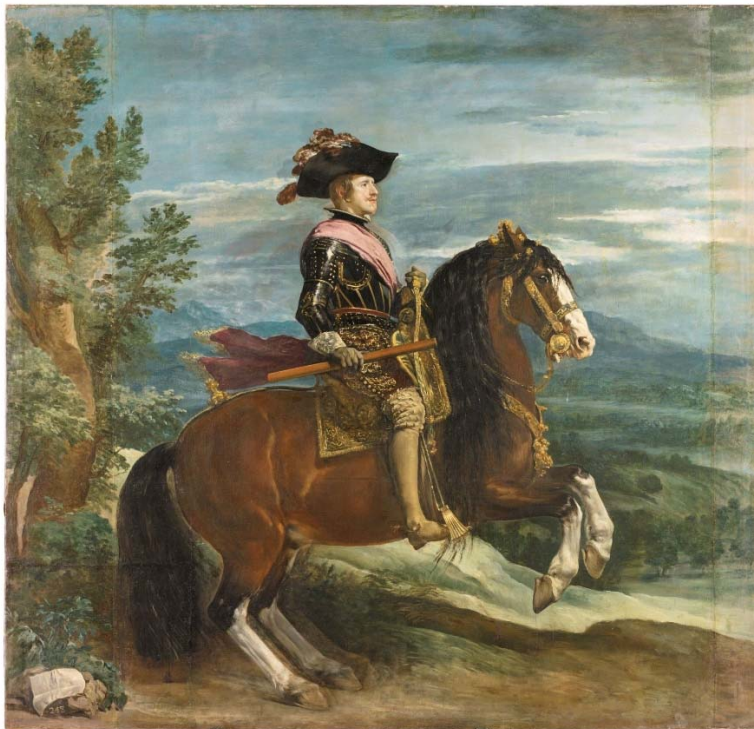
Il re di Spagna Felipe IV – Olio di Velasquez, 1635 – Museo del Prado di Madrid