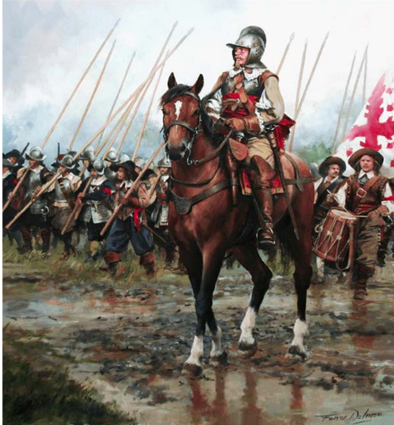
Capitano al fronte del suo “Tercio”: la famosa unità della fanteria spagnola del XVII secolo