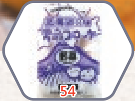
日本野菜薯餅 約440g / 8件 零售價$59 會員價$38