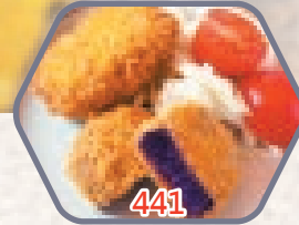
紫心蕃薯餅 10件 零售價$42 會員價$25