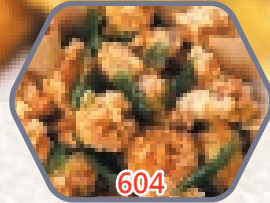
台式鹽酥雞 約454g / 約1磅 零售價$48 會員價$39.5