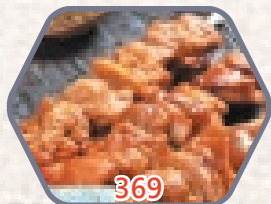
炭燒雞腿肉串燒 約270g / 一包10串 零售價$39 會員價$23.5