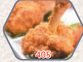
韓式炸辣味雞鎚 約500g / 約7-8件 零售價$68 會員價$49