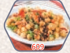
急凍爽脆墨魚咀 約454g / 約1磅 零售價$48 會員價$39.5