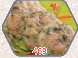
家鄉小棠菜墨魚餅 約300g 零售價$46 會員價$38