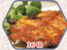
西班牙蜜糖芥末味 豬仔骨(無激素) 約500g 零售價$89 會員價$68