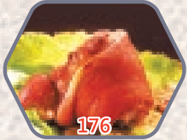
無骨(原隻)德式黑椒咸豬手 約300g 零售價$56.5 會員價$36