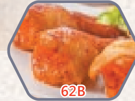
日式明太子餃子雞翼 約500g / 10件 零售價$128 會員價$78