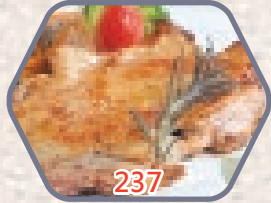
雞扒(勁蓉) 約1磅 / 約3-4件 零售價$49.5 會員價$36