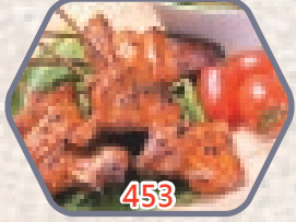
串燒水牛城雞中翼 約4串 / 8隻 零售價$58 會員價$36