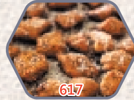
日本芝士雞肉漢堡粒 約500g 零售價$98 會員價$89