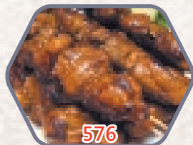
馬來沙爹豬柳串(生) 6串 零售價$38 會員價$32