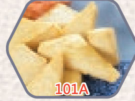
新界鮮味炸魚角 約300g 零售價$36 會員價$26