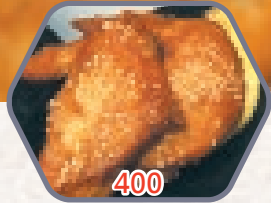
炸芝麻雞翼 6件 零售價$54 會員價$38