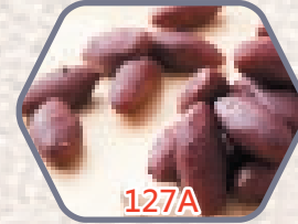
日本迷你燒甜薯 約50粒 零售價$69 會員價$48