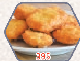
蜜樂雞 13件 零售價$32 會員價$19