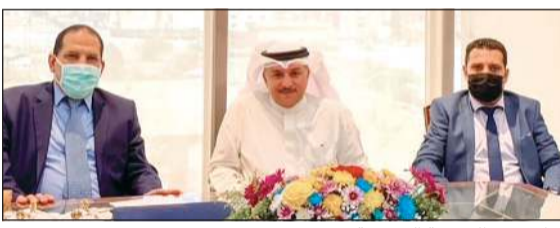
جانب من الجمعية العمومية

ضئيلة للغاية تعكس قوة وتمتانة المركز المالي للشركة. وعن توقعاته للعام المقبل، قال الشمالي إن هناك بشائر واضحة لبداية انحسار الوباء في المستقبل القريب وأن محصلة الجهود التي تبذلها الحكومات والدول على مستوى العالم بدأت تؤتي ثمارها وهو ما يمهد الطريق نحو عودة فتح الاقتصاد العالمي خلال المرحلة المقبلة بشكل قوي.