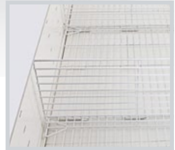
TEL RN ARA BLC WIRE PRODUCT DIVIDER