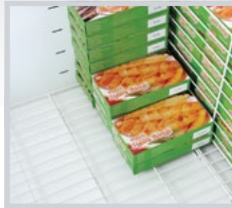
TEL TABAN BASE WIRE TRAY