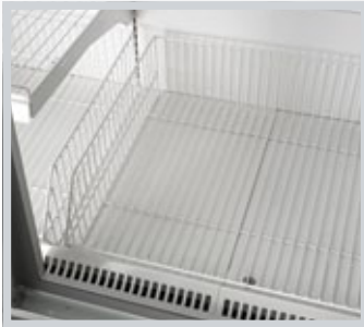
TEL SEPET WIRE BASKET