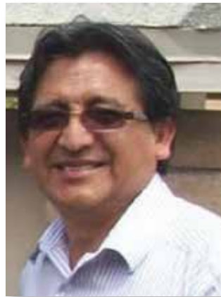
Por FRANCISCO JAUREGUI

E l Censo Nacional de Población 2020 en los Estados Unidos, como en otros países, es un proyecto de gran magnitud, motivo por el cual sus actividades se agrupan en tres etapas. La primera, etapa pre censal, comenzó con años de anticipación y culminará en el presente año, comprende las actividades preparatorias, como el planeamiento, presupuesto y el cuestionario, entre otros. Luego, viene la etapa censal, que comprende la actividad principal de empadronamiento o conteo de toda la población. Finalmente, la etapa post censal, que comprende el procesamiento y publicación de los resultados en forma oportuna.