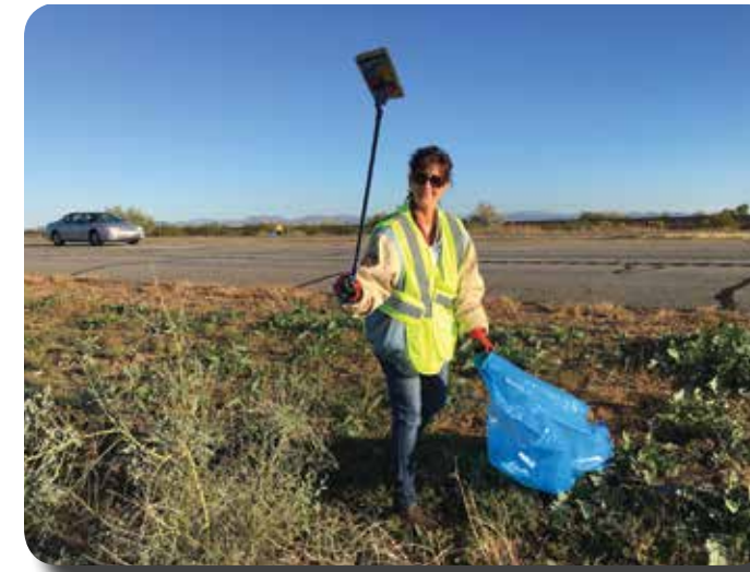
¡Una foto vale más que mil palabras! ¿Y cuatro?... Nos dan la idea de este artículo.

Si necesita información o le gustaría formar un grupo llámeme al 602-712-8989 para orientarlo.