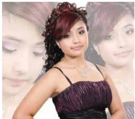
Foto y video para bodas, quinceañeras, bautizos y más 623-500-1420