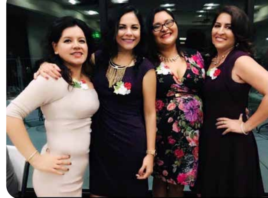
La belleza peruana en el club de damas.