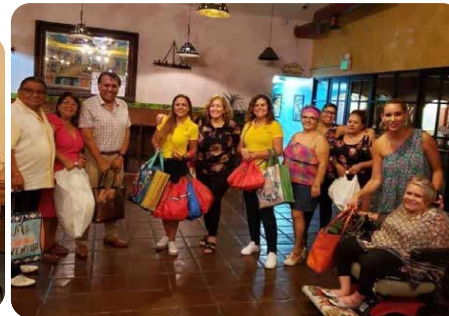
Las donaciones listas para llevar a los necesitados