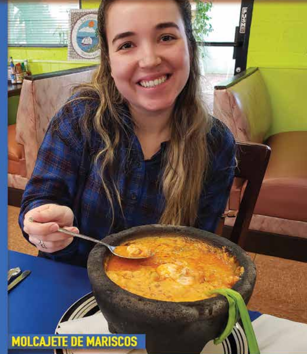
MOLCAJETE DE MARISCOS