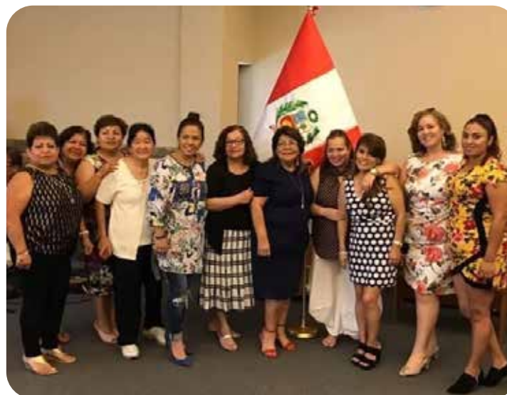
Participando en una de las actividades de peruanidad