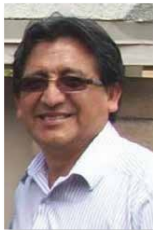
Por FRANCISCO JAUREGUI

E n los últimos años, las mujeres inmigrantes latinas en el país han logrado destacados logros en distintos campos de la sociedad. En esta oportunidad quisiera destacar cómo las mujeres peruanas residentes en Arizona, vienen apoyando a la comunidad a través de la organización social denominada Club de Damas Peruanas residentes en Arizona.