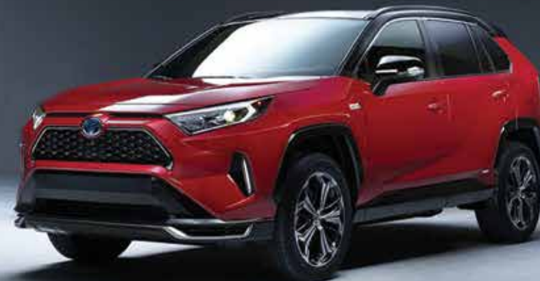
RAV 4 2021

* PARA MÁS DETALLES VISITE EL CONCESIONARIO Y PREGUNTE POR ENRIQUE MORENO