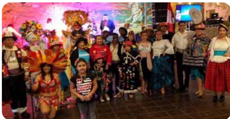
Haciendo sus presentaciones luego de las clases de danzas