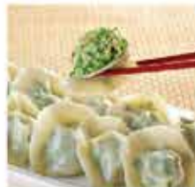
579/580. 台灣手工韭菜豬肉餃/ 台灣手工高麗菜豬肉餃 約720g(約40粒) 零售價 - $46.5 會員價$38.5