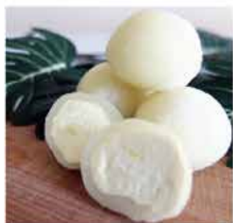
30A. 馬來西亞D24純檳榔肉糯米糍 約240g/8件 零售價 - $68 會員價$45