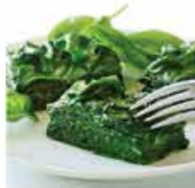
582. 精選菠菜菜 約1Kg 零售價 - $38.5 會員價$29.5