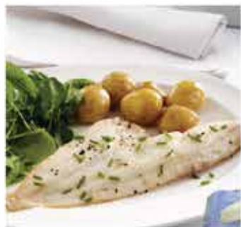
143. 澳洲一級白肉龍利柳(稔魚柳) 約480g 零售價 - $68 會員價$38