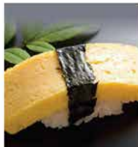
575. 東洋和風玉子燒(壽司蛋) 約500g 零售價-$36 會員價$28