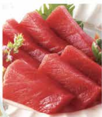
96. 原件吞拿魚刺身 約300g-500g 零售價-$168 會員價$148