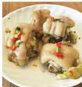
548. 泰辣秘製酸辣豬手 約454g 零售價-$48 會員價$42