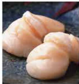
377A. 日本帶子刺身 約250g/約16-18隻 零售價-$128 會員價$98