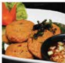
145. 泰國Sifco泰式魚餅 約400g/約20件 零售價 - $68 會員價$38