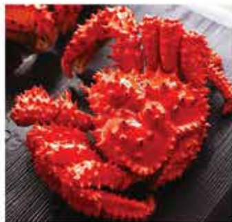
191. 北海道根室冷凍花咲(兆)蟹(熟) 約600g 零售價 - $XXX 會員價$278