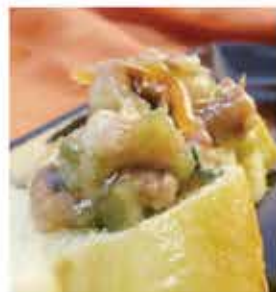
182. 芥辣八爪魚 約250g 零售價-$83 會員價$56