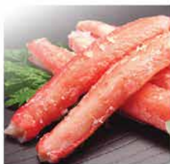
57. 大吉松葉蟹棒 約270g/約30件 零售價 - $62 會員價$38