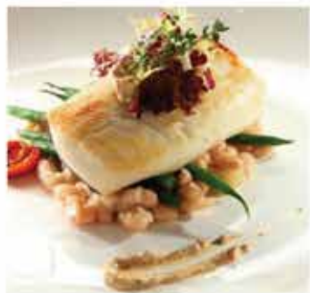
413. 紐西蘭“鱈魚”柳(無皮無骨) 約440g/4件裝 零售價 - $68 會員價$42.5