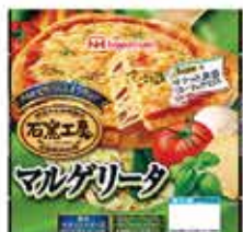
497. 瑪格麗特披薩 約185g/直徑約23cm 零售價 - $55 會員價$42.5