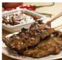
577. 馬來沙嗲牛柳串(生) 6串 零售價 - $42 會員價$36