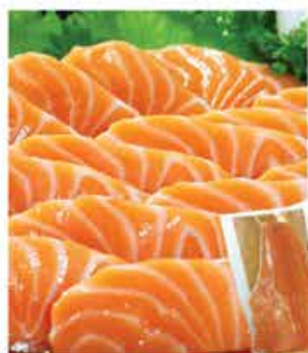
37/37A. 挪威原件冰鮮三文魚柳刺身 約700g/約2kg 零售價-$198/562 會員價$148/398