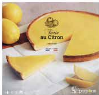
500. 法國清香檸檬挞 約450g 零售價 - $89 會員價$68.5