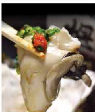
49. 日本廣島去殼刺身生蠔 Size L 約36-45隻/約1kg 零售價-$278 會員價$159