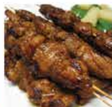
576. 馬來沙嗲豬柳串(生) 6串 零售價 - $38 會員價$32