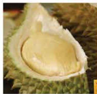
121. 馬來西亞"XO榴槤"榴蓮肉 約400g 零售價 - $195 會員價$178