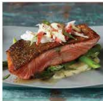
220. 挪威有機連皮三文魚柳 約500g/約4pcs 零售價 - $140 會員價$108