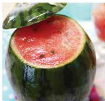
513. 日本原個(西瓜)雪葩 約200g 零售價 - $68.5 會員價$53