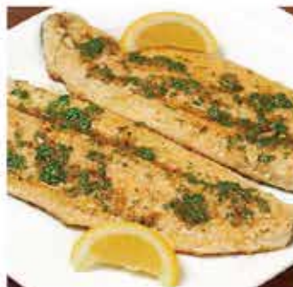
517. 原件石斑大魚柳(連皮) 約500g 零售價 - $108 會員價$85