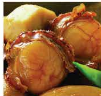
393. 日本太子貝2S 約300g 零售價 - $56 會員價$29.8