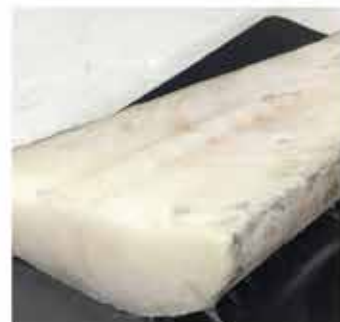
574. 英國白鱈魚連皮魚尾扒 約227g-250g 零售價 - $108 會員價$89.5