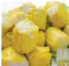
247. 魚肉燒賣 約454g 零售價 - $33 會員價$19.8