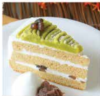
446. 日本Go!Yo!抹茶蛋糕 約480g/12件 零售價 - $172 會員價$148