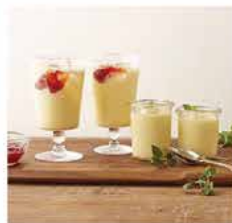
596. Kewpie日本配方丘比冷凝固濃綿布 丁原裝(免蒸煮) 約500g 零售價 - $92 會員價$78