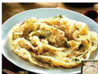
26. 台灣香蔥手抓餅 約680g 包5塊/每塊直徑約8吋 零售價 - $36.5 會員價$28.5