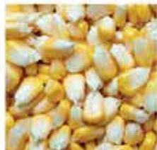
589. 馬來西亞原粒刺落粟米 (非刀切) 約500g 零售價 - $32.8 會員價$23.8