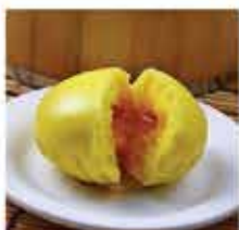
588. 蛋黃黃金流沙包(馬來西亞製造) 8件裝 零售價 - $39.5 會員價$34.5