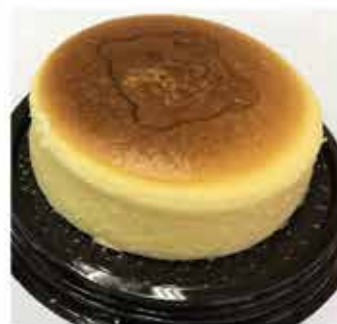
591. 香濃烘焗芝士蛋糕 約300g 零售價 - $98 會員價$78