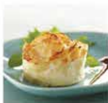
563. 法國焗芝士忌廉千層薯 2件裝/約240g 零售價 - $66 會員價$38.5