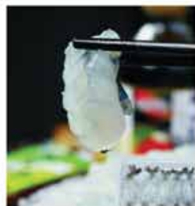
124A. 泰式生蠔刺身 約20件 零售價-$69.6 會員價$23