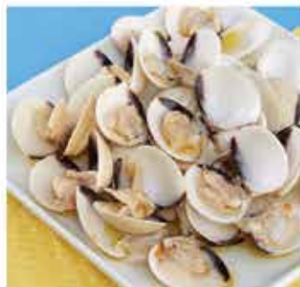
496. 越南白銀(熟) 約500g 零售價 - $36 會員價$26