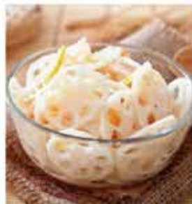
384. 柚香蓮藕(即食) 約250g 零售價-$36 會員價$26