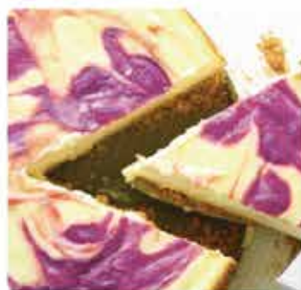
48D. 美國原裝空運入口檸檬藍莓 芝士蛋糕 約720g 零售價 - $298 會員價$189