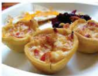
552. 泰式冬蔕炸蝦籠 10件 零售價 - $48 會員價$42