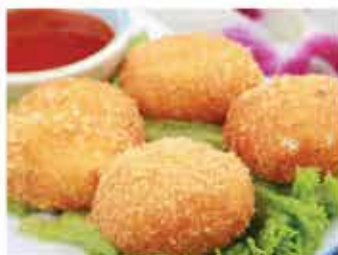
164. 泰國泰式炸蝦餅 12件/約250g 零售價 - $42 會員價$29.5