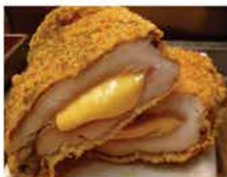
135. 台北士林吉列芝心雞扒 5件 零售價 - $89 會員價$69.5