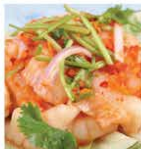
323A. 泰辣去骨酸辣鳳爪(熟) 約300g 零售價-$68 會員價$49.5