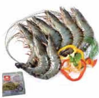
79E. 越南有頭虎蝦(L) 約300g 零售價 - $78 會員價$48