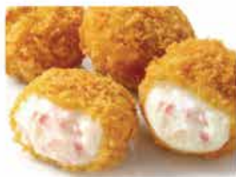
141. 北海道津別牛乳蟹肉薯餅 約600g (8件) 零售價 - $120 會員價$69.5