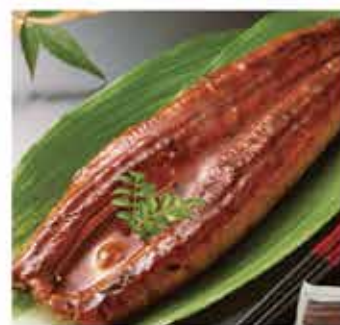
91. 日式蒲燒鰻魚 約280g-300g 零售價 - $108 會員價$79.5