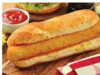
561. 炸蝦熱狗棒 5件裝/約300g 零售價 - $64 會員價$48