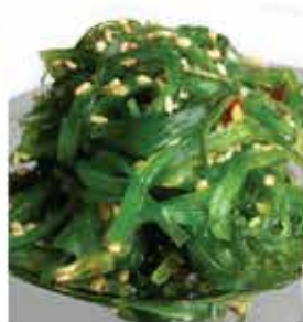
99. 中華沙律 約500g 零售價-$60 會員價$35