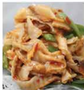
131. 日式味付帶子豬蹄 約500g 零售價-$92 會員價$58