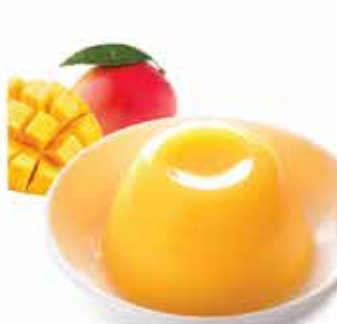
429. 台灣愛文芒果 "鮮果肉"布汀 約130g/杯 零售價 - $18.5 會員價$15