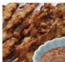
38. 馬來西亞沙嗲烤雞串燒 約140g/一包6串 零售價 - $36 會員價$28