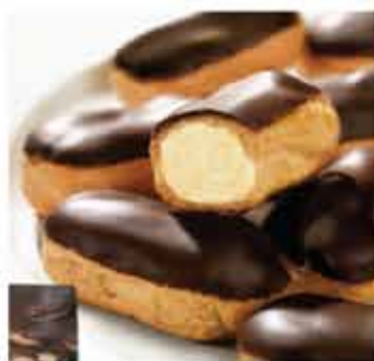
114. 迷你朱古力脆皮忌廉巴夫條 10條/約160g 零售價 - $48 會員價$30.5