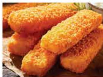
58. 吉列炸魚手指 約40件/約1kg 零售價 - $112 會員價$87