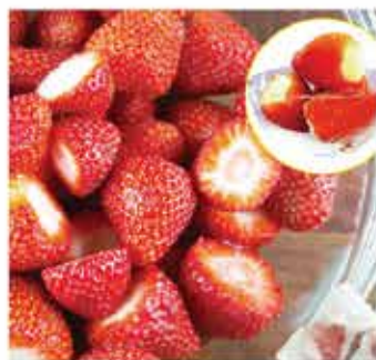
276. 日本原個草莓雪葩 約6粒 零售價 - $66.5 會員價$39.5