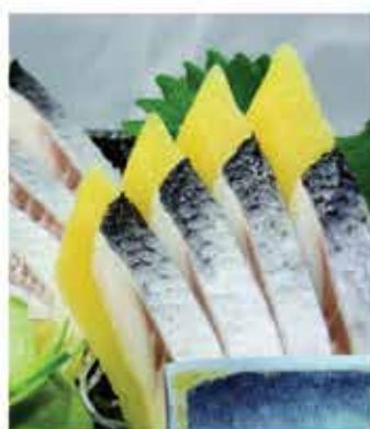
95A. 希置魚子刺身 約120g 零售價-$38.6 會員價$27