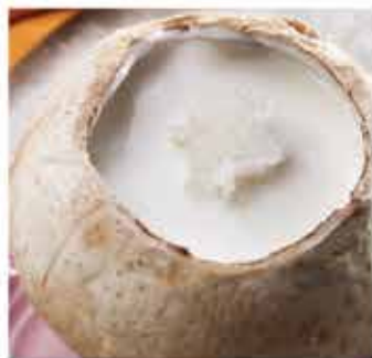
520. 原個椰皇雪燕燉鮮奶 約220g/個 零售價 - $46.5 會員價$38.5