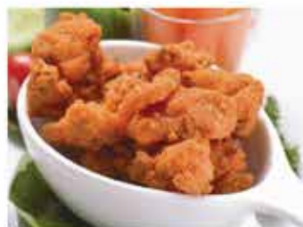
404. 韓式炸辣味雞塊 約500g 零售價 - $68 會員價$49