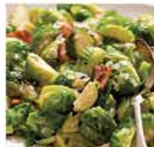
581. 比利時椰菜仔 約1Kg 零售價 - $32 會員價$23