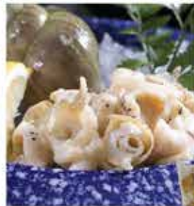
169. 加拿大翡翠螺XL加大碼 約500g/約6-8隻 零售價-$72 會員價$48