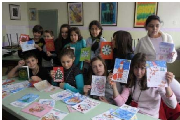
Резултатите от усърдната работа

Коледа и Нова година са най-хубавите празници в годината. С приближаването им в НСОУ „София“ започва да тече трескава подготовка. Добра традиция в нашето училище е организирането на благотворителен Коледен базар през месец декември. Всеки клас взема активно участие в него. От сръчните ръце на учениците се раждат чудни коледни картички. Много въображение и вкус са проявили всички участници. След това всеки клас има свой ден, в