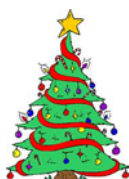
На Коледния базар