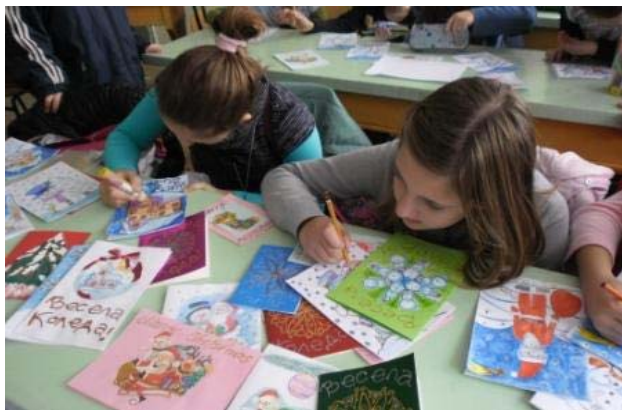
В коледната работилница

Учениците от студио „Арт дизайн“ са посланици на доброто!