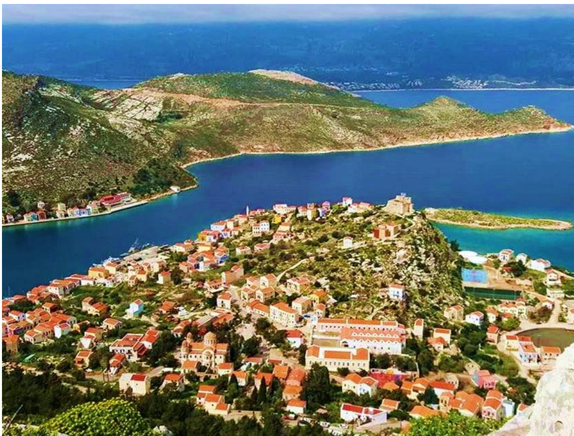
Panoramica di Kastellorizo con il suo "castello rosso" in cima al promontorio

Da allora la popolazione è più che raddoppiata, grazie a una crescita inaspettatamente impulsata dalla popolarità del film interamente italiano 'Mediterraneo' del bravo regista Gabriele Salvatores, vincitore nel 1992 del premio Oscar al miglior film straniero, liberamente ispirato al romanzo 'Sagapò' di Renzo Biasion, fantasiosamente ambientato proprio negli anni della seconda guerra mondiale e girato quasi per intero tra gli angoli più paradisiaci e suggestivi della remota isola greca di Kastellorizo. Quel film si rivelò quale segnale per un incipiente risorgere nell'isola, dell'economia e della vita, questa volta in chiave turismo, un risorgere animato, principalmente e per una volta ancora, dagli italiani, nonché – e mi consta – anche dai brindisini.