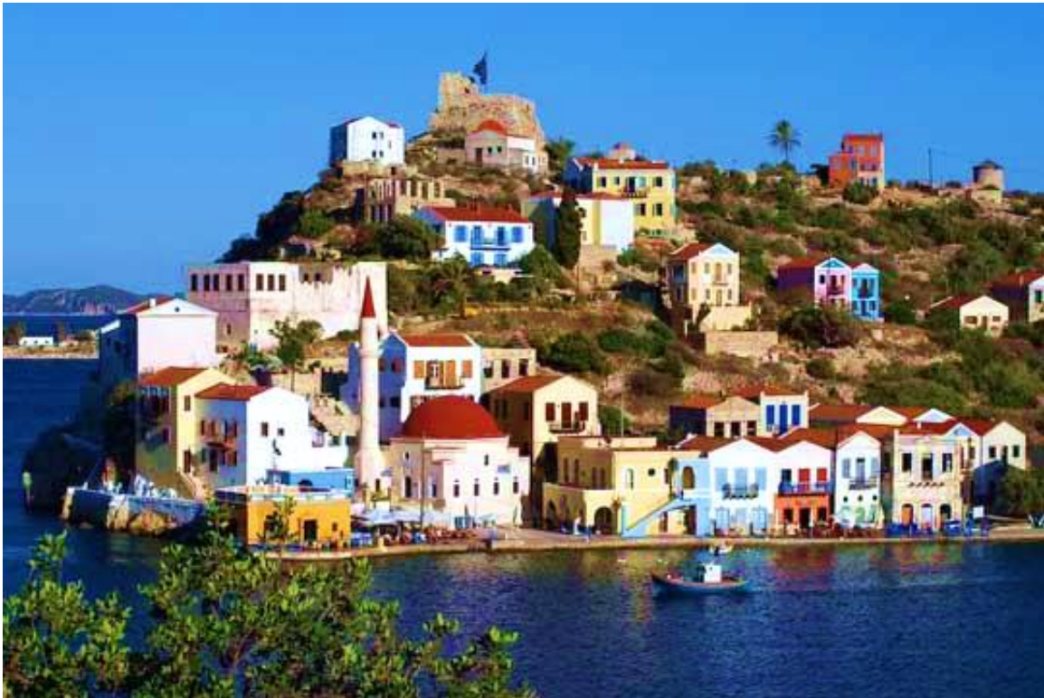
Kastellorizo con il castello di San Nicola