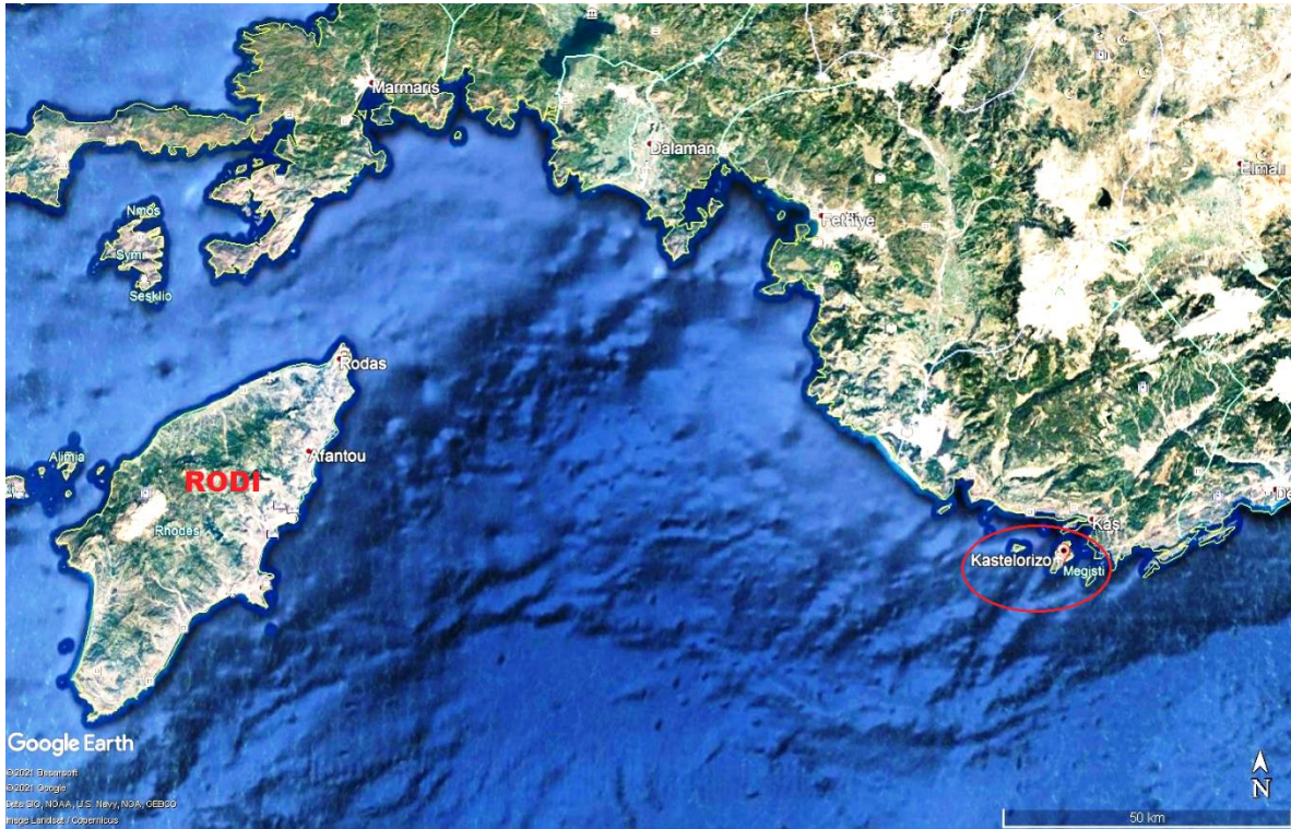
L'isola greca di Kastelorizo nell'Egeo orientalea 110 Km da Rodi