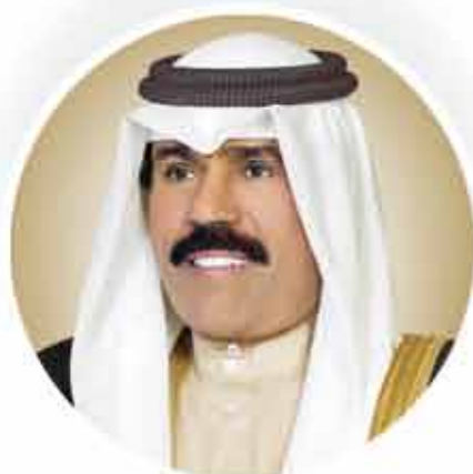
صاحب السمو الشيخ نواف الأحمد الجابر الصباح ولي العهد