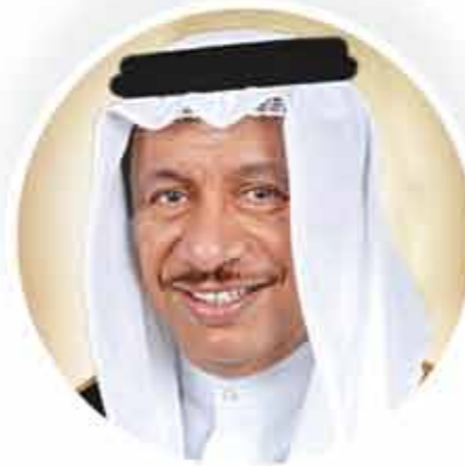
صاحب السمو الشيخ جابر المبارك الحمد الصباح رئيس مجلس الوزراء