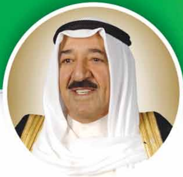
صاحب السمو الشيخ صباح الأحمد الجابر الصباح أمير دولة الكويت