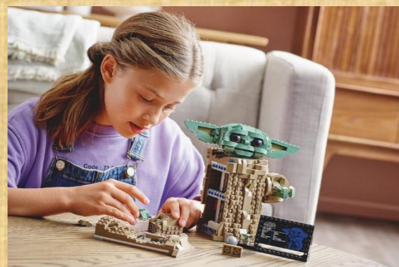
Jeux de construction