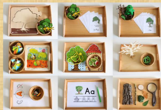
Plateaux de vie pratique